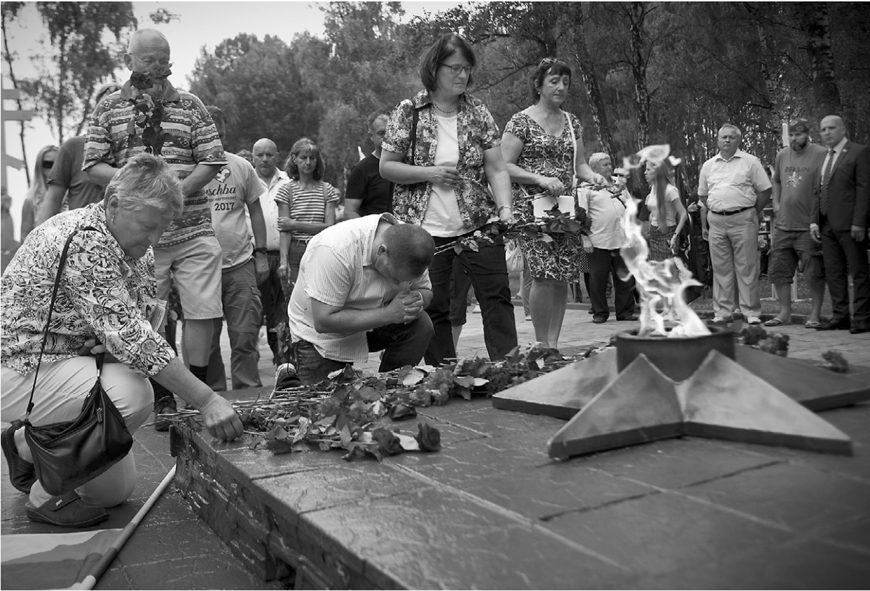
Гости из Германии склонили головы перед подвигом советских солдат