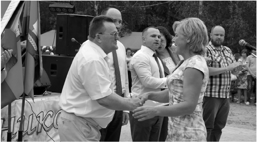
Лучшие труженики района были награждены почётными грамотами и благодарностями