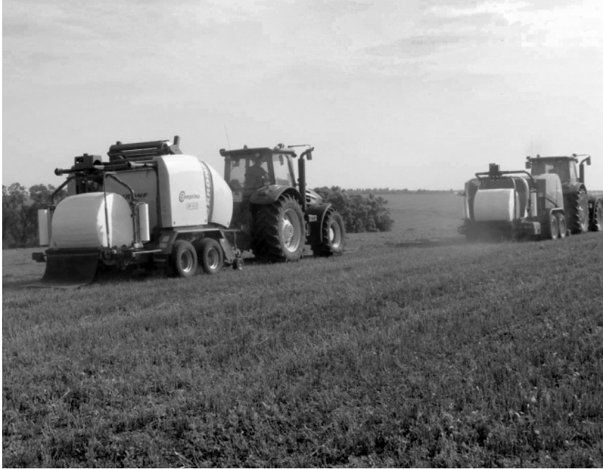
В ЗАО «Славянское» заготовку кормов ведут по новым технологиям