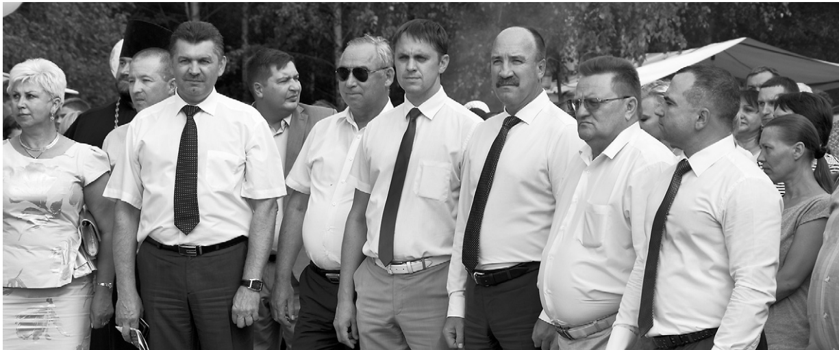
Поздравить жителей района с праздником приехали почётные гости

От имени губернатора Орловской области жителей и гостей района с праздником поздравил и. о. заместителя председателя правительства Орловской области