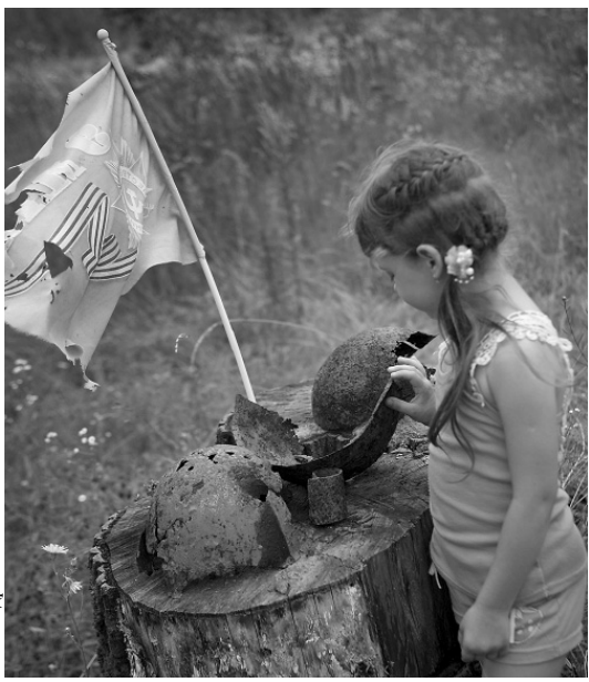
Долгое эхо войны

Останки, которые поисковикам удалось уже извлечь из зем-