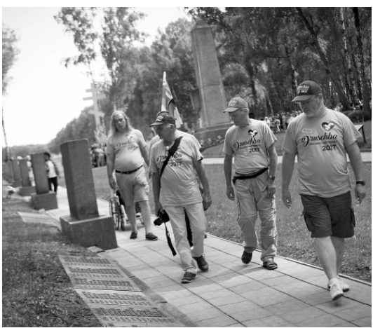
На Кривцовском мемориале

дия Алфёрова. — Рядом с ними мы обнаружили миномётный ящик. Также здесь находятся каска СШ-40, противогаз с фильтрационной коробочкой, лопатка,