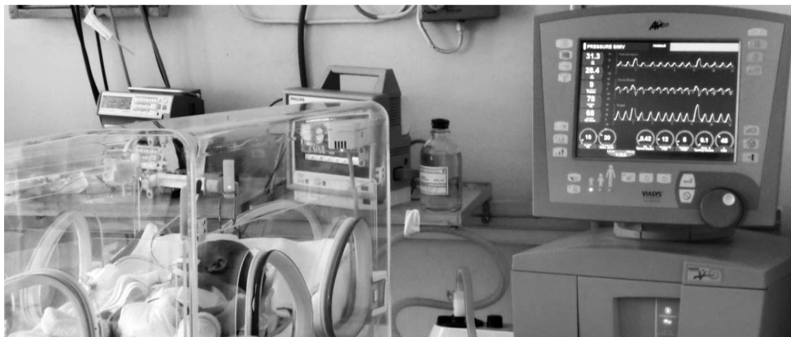
Чуткие мониторы слежения улавливают все изменения в организме крошечного пациента

В реанимацию поступили новые мониторы для слежения за состоянием тяжёлых детей, системы для выхаживания малышей с низкой массой тела, противоожоговая кровать, которая позволяет не травмировать ожоговые раны.