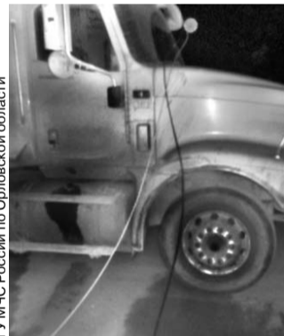
ГУ МЧС России по Орловской области

● В Орле водитель тягача-бензовоза припарковался на улице МОПРа возле ресторана «Третий Рим» и отправился на автозаправку, которая находится напротив. Тягач стоял несколько минут и вдруг... покатился. Первым препятствием на его пути оказался фонарный столб. Столб накренился и медленно рухнул на припаркованную «Волгу», изрядно ее примяв. Затем кабина бензовоза и цистерна начали складываться, прижав друг к другу еще четыре автомобиля. Утечки топлива не произошло.