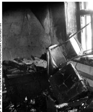
ГУ МЧС России по Орловской области

● Заполыхал частный дом на улице Чкалова в Орле. Пожару был присвоен повышенный номер сложности из-за опасности распространения огня на соседние дома. Избежать этого удалось, но в доме был обнаружен труп 50-летнего мужчины. Причины пожара устанавливаются.