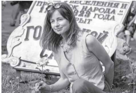
Красота своими руками

— Сделать наш город ярче, красивее, чище, наверное,