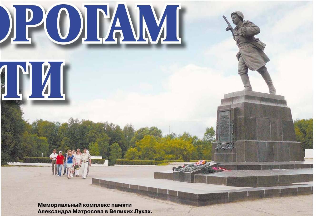
Мемориальный комплекс памяти Александра Матросова в Великих Луках.

В середине июля в городе Орле стартовал автопробег «Первый салют». На днях его участники вернулись обратно. Юбилейный, десятый, автопробег был посвящен 65-летию Великой Победы и 67-й годовщине освобождения Орла от немецко-фашистских захватчиков. Маршрут этого года (Орел — Кронштадт — Орел) был особенным, ведь участники автопробега посетили десять городов воинской славы.