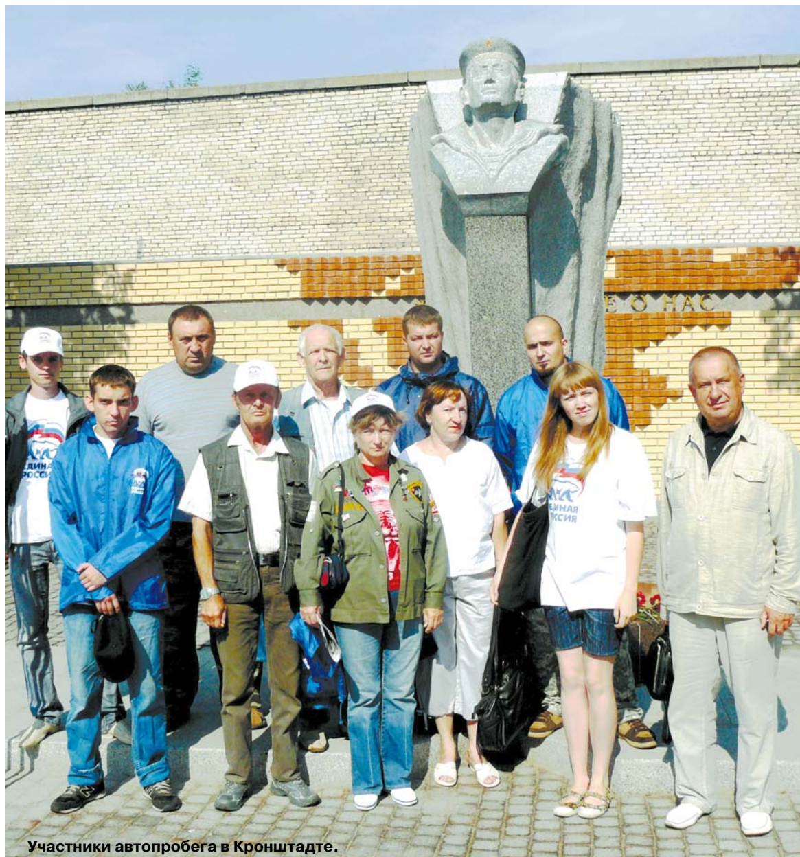
Участники автопробега в Кронштадте.

таких походов уделяется военно-патриотическому воспитанию молодежи. Участники автопробега стараются найти и сделать известными такие факты Великой Отечественной войны, которые раньше замалчивались.