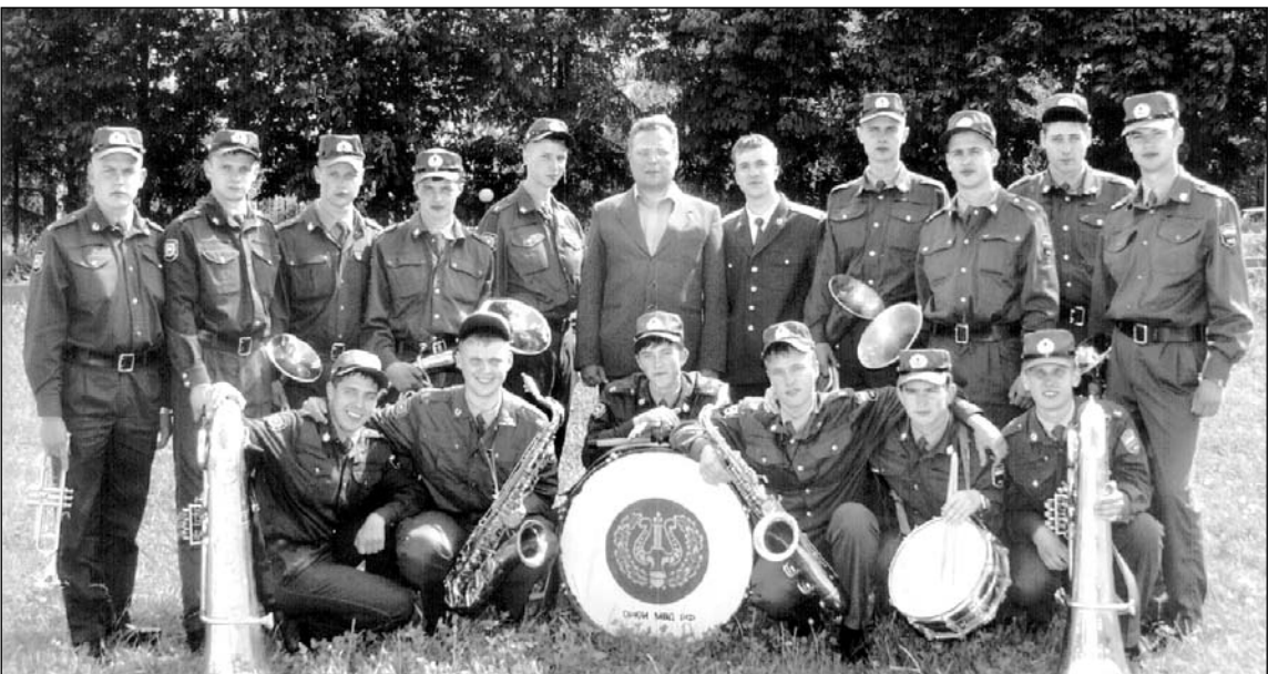
Духовой оркестр Орловского юридического института МВД России. Июнь 2004 г.

— В тот день был выпускной у студентов-заочников, и мы с ребятами решили организовать