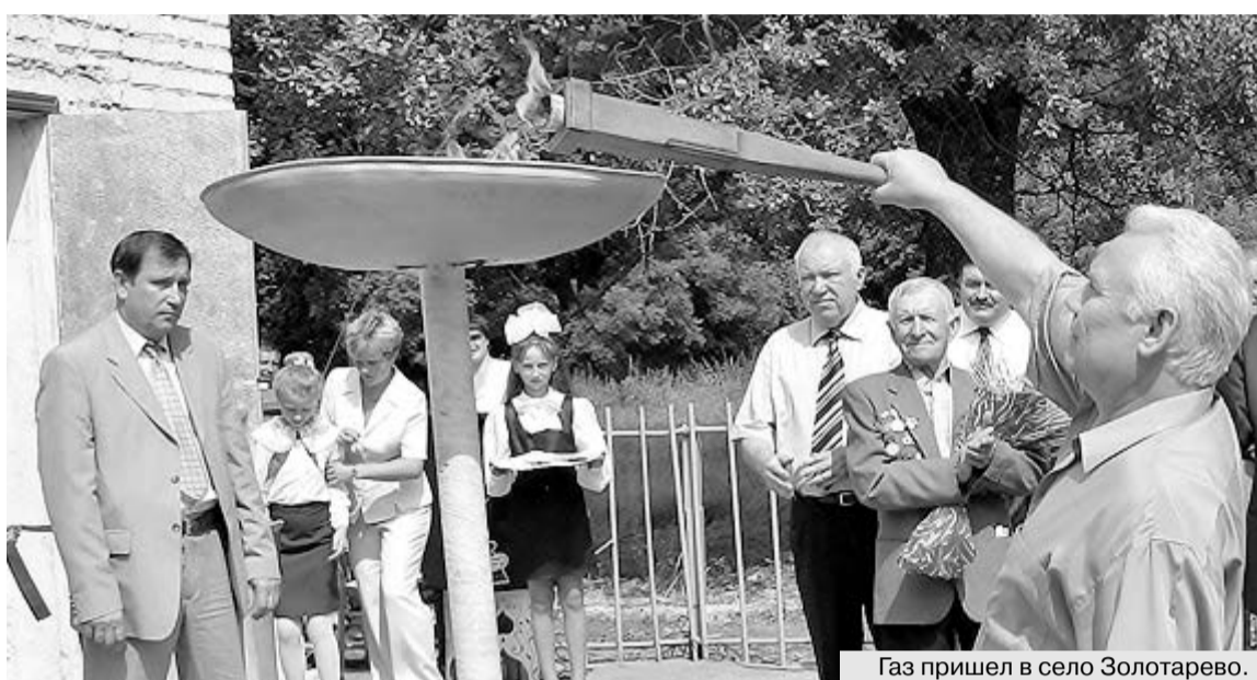
Газ пришел в село Золотарево.