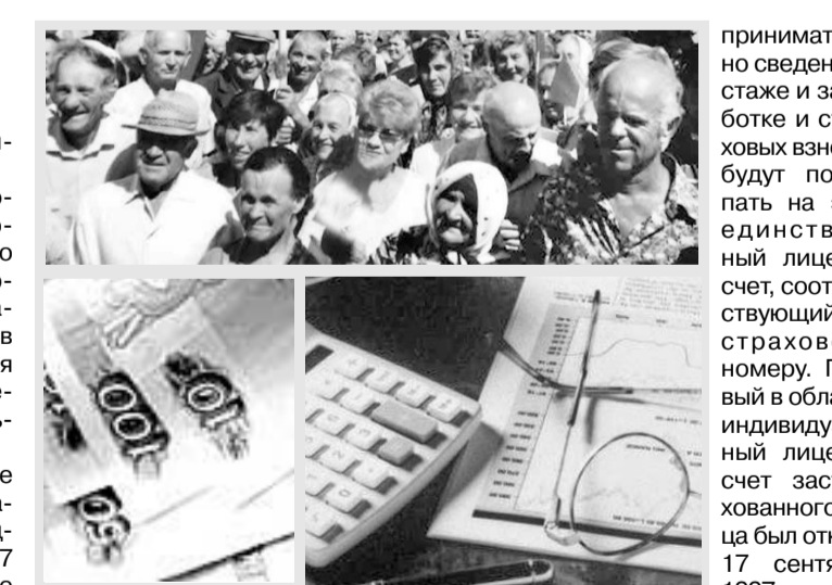
Пенсионеры в Орловской области.

Оплата труда составила 720 рублей за 20 дней (такова была продолжительность одной смены). При этом с каждым подростком заключался трудовой договор с оформлением свидетельства в соответствии с Трудовым кодексом РФ.