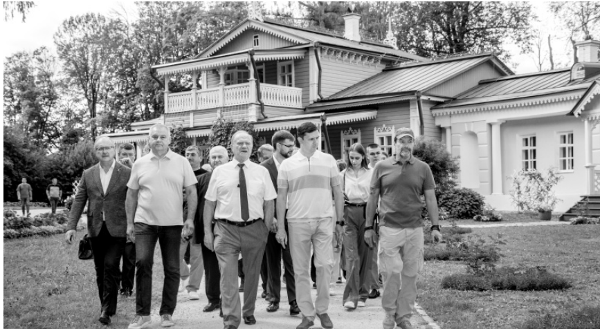
На открытии выставки в Спасском