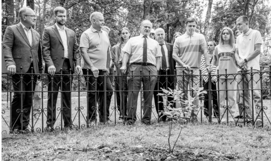
Растёт, растёт тургеневский дубок!