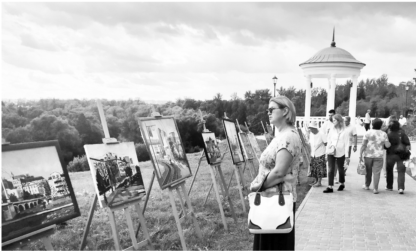
На работах студентов ОХУ им. Г.Г. Мясоедова — виды любимого города

— Орёл — город, повернувшийся лицом к воде, по нашей набережной можно пройти почти 10 километров, не выходя ни на одну проезжую часть, — отметил он. — Идёт масштабная работа по благоустройству областной столицы, городов и посёлков области, в последние годы мы смогли реконструировать более 220 общественных пространств. «Дворянское гнездо» — ключевое литературное пространство Орла, визитная карточка города, хранящая па-