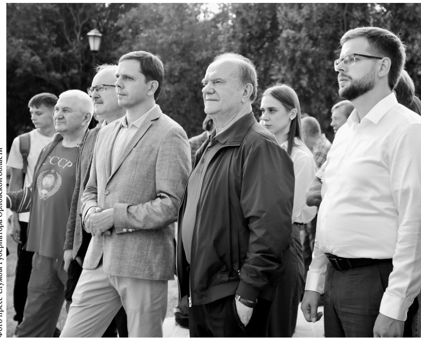
Обновлённая Дворянка радует всех