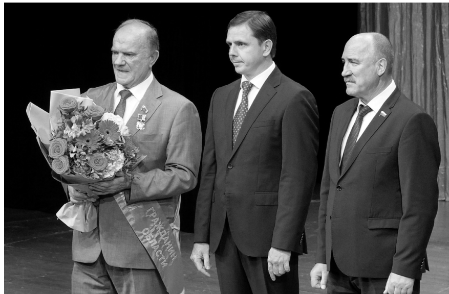
Чествование Геннадия Андреевича Зюганова

нил, что в этом году нашему выдающемуся земляку Геннадию Зюганову указом Президента РФ присвоено звание Героя Труда Российской Федерации, а депута-