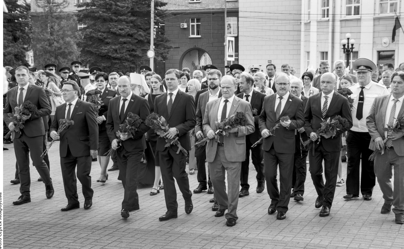
5 августа в Орле было много торжественных и волнующих моментов