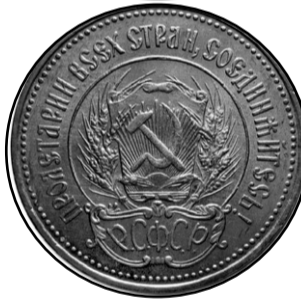
Монета содержит 7,74 г золота 900-й пробы, весит 8,6 г