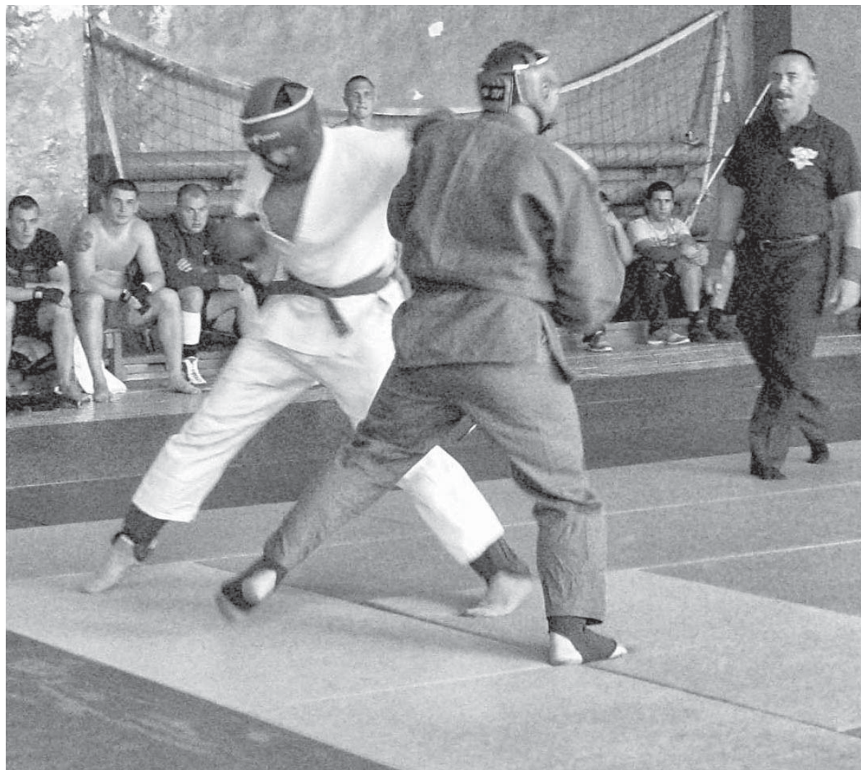
Чемпионат показал высокий уровень владения приемами рукопашного боя нашими полицейскими

17 АВГУСТА ЗАВЕРШИЛСЯ ЧЕМПИОНАТ УМВД РОССИИ ПО ОРЛОВСКОЙ ОБЛАСТИ ПО РУКОПАШНОМУ БОЮ