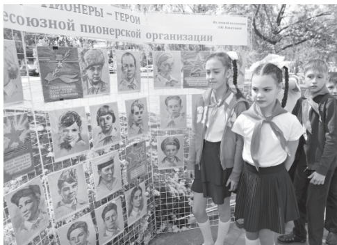
Пионеры XXI века равняются на героев пионерского движения

о своём детстве, когда они были пионерами. Они отлично учились, делали добрые дела, помогали пожи-