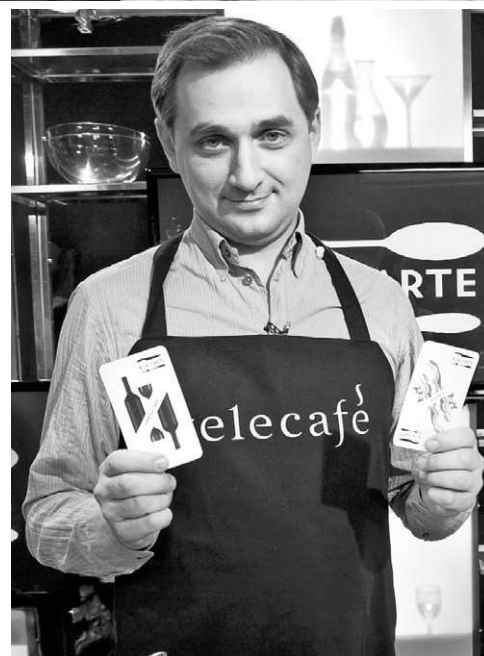
Пряников демонстрирует карты шоу «A la carte»

чается в том, что жрать нужно меньше. А если серьезно, то есть нужно часто, но небольшими порциями. Я жалею тех людей, которые вынуждены в чем-то себя ограничивать. В Калмыкии я познакомился с одной бабушкой, которой уже 90 лет, она до сих пор себя хорошо чувствует. И она сказала, что всю жизнь ела мало, но всегда сытно. А то, знаете, люди начинают есть различные травы, а потом из-за них раздуваются.