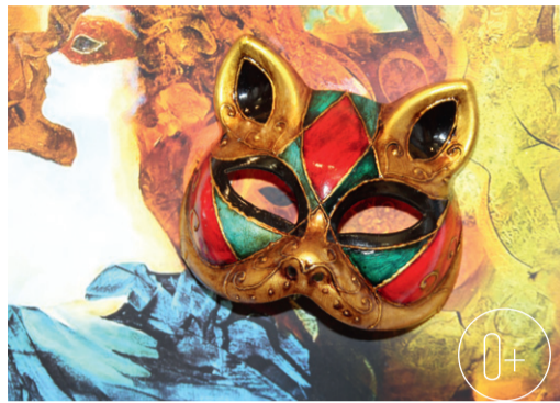
А. Бринетто. «Венецианский вид». Середина XIX — начало XX века

— Каждая маска имеет свой смысл и название. Как вот эта — «Баутта» — одна из самых популярных венеци-