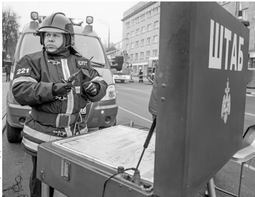
Штаб — мозговой центр учений