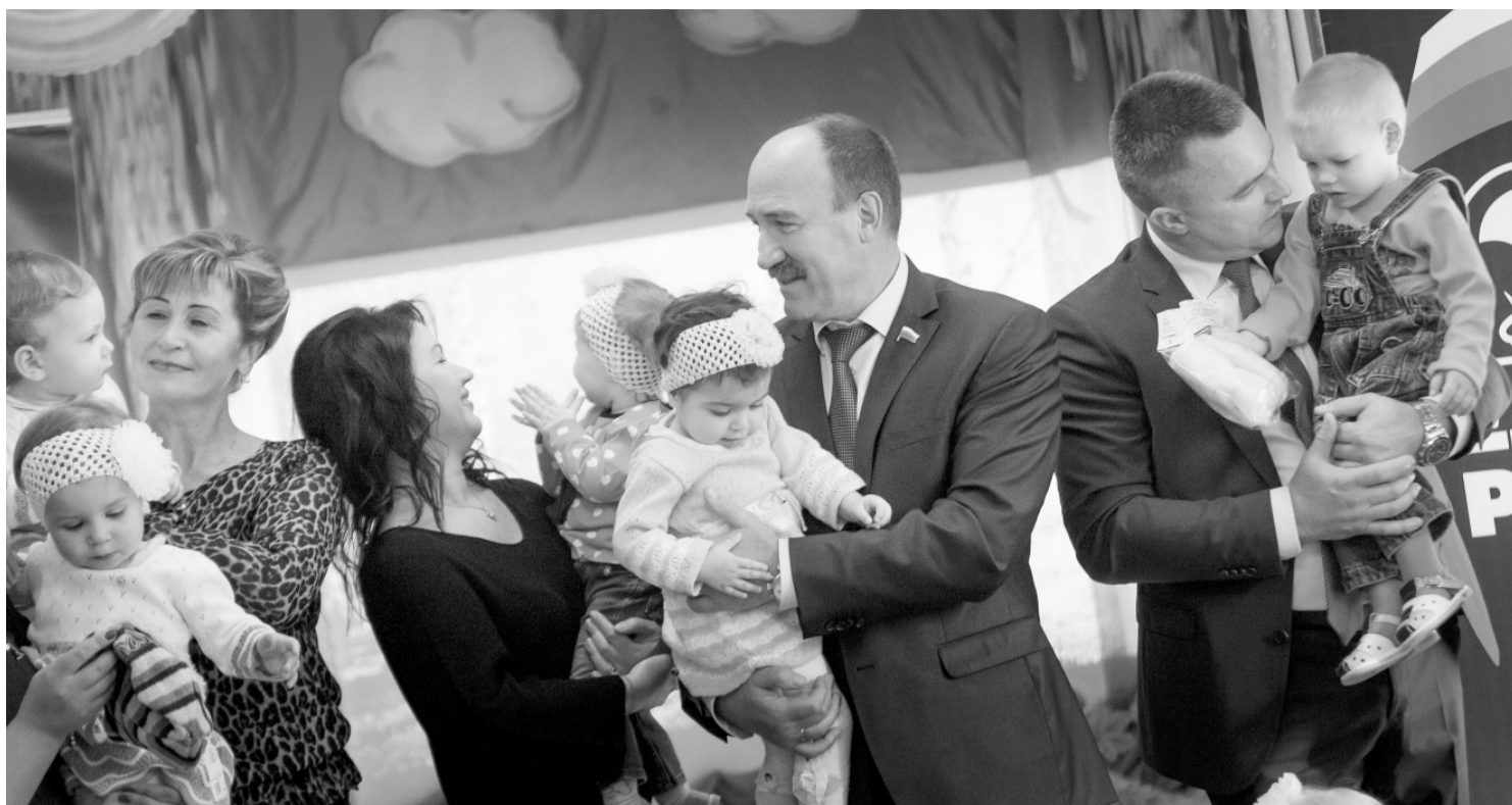
Орловские депутаты – шефы специализированного дома ребёнка в Орле

Позволю себе уйти от сухой статистики и назову несколько социально значимых законов, принятых областным Советом.