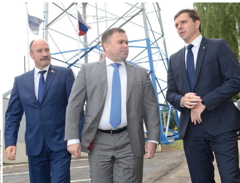
На открытии Кромского РЭС после ремонта

— Закончены подготовительные работы по реализации проекта «Программный метод выявления неучтенных объемов электроэнергии с использованием технологии «Big Data». Завершена разработка технических решений по телеметрии на ТП и начат монтаж комплексной системы энергомониторинга и установка распределенной автоматизации в цифровых районах электросетей.