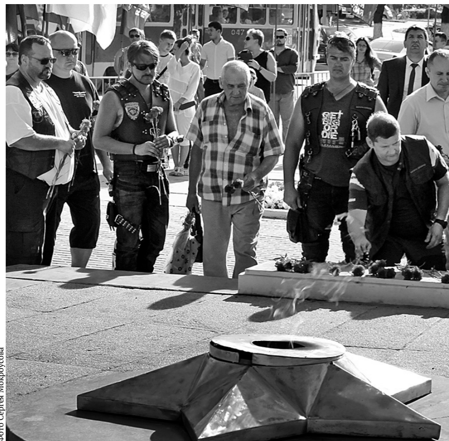
Цветы к Вечному огню — дань памяти погибшим за Родину воинам