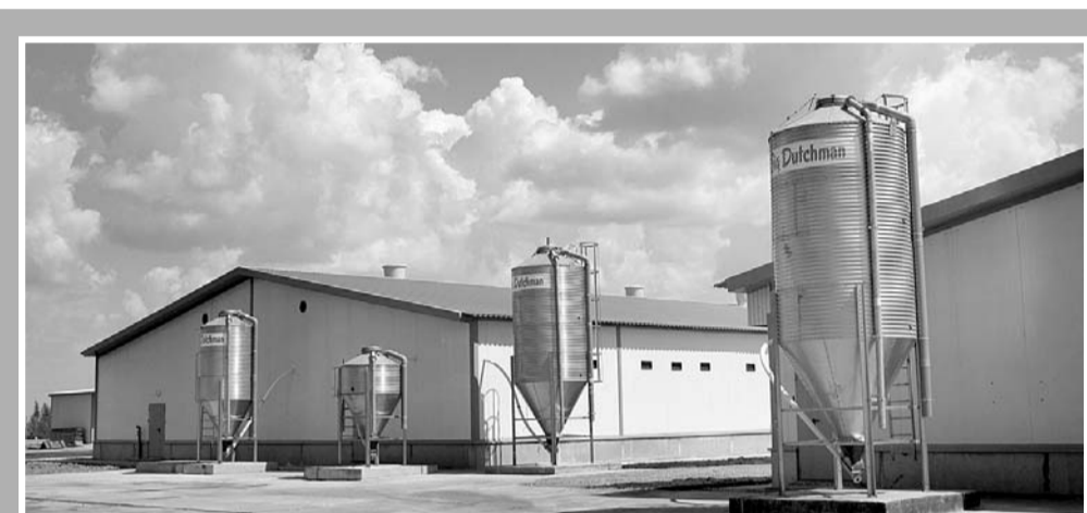
Один из объектов Знаменского селекционно-генетического центра, построенных компанией «Эксима» в нашей области в рамках крупного проекта по развитию свиноводства.