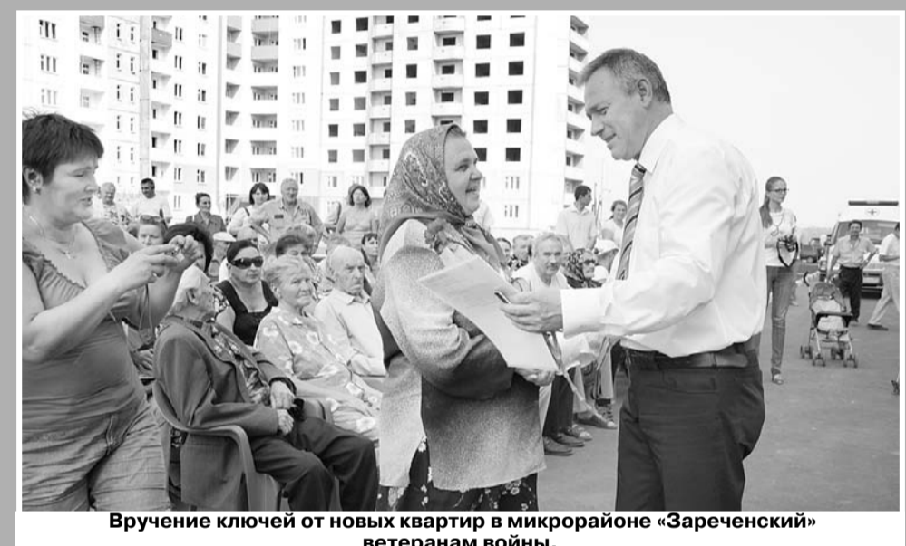
Вручение ключей от новых квартир в микрорайоне «Зареченский» ветеранам войны.