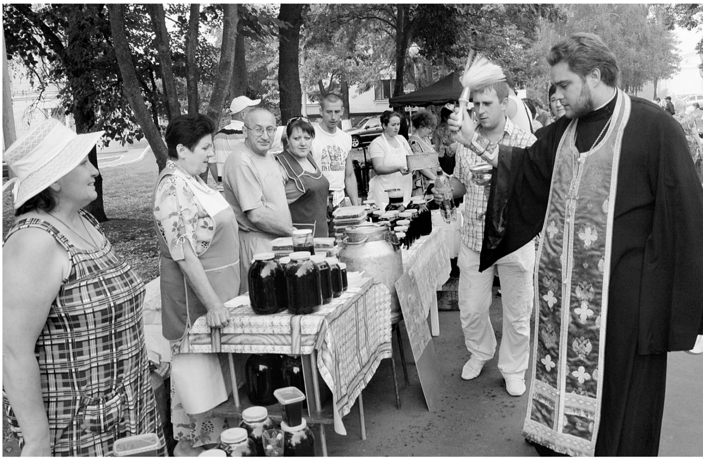
Чудо как хорош этот Медовый Спас!

В субботу, в день Медового Спаса, на площадке перед входом в городской парк культуры и отдыха состоялась традиционная ярмарка меда. Более 80 участников — пчеловоды, заготовительные организации, сельхозпредприятия — привезли на импровизированную торговую площадку ароматную продукцию орловских пчеловодов — мед, пергу, пылицу.