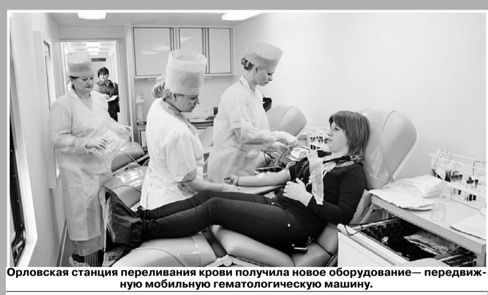
Орловская станция переливания крови получила новое оборудование — передвижную гематологическую машину.