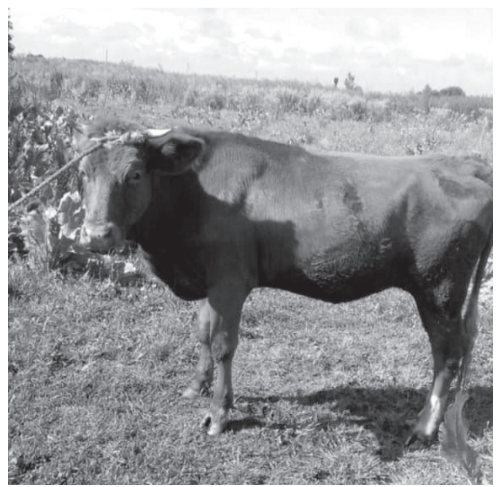
Прудик, цветы и тёлка Марта