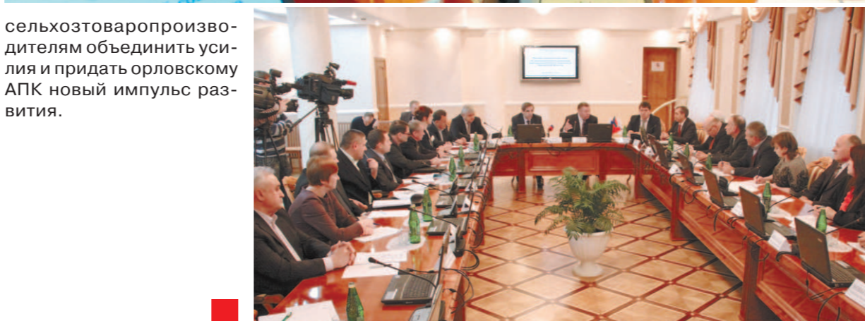
Первое заседание совета прошло в стенах ОрёлГАУ