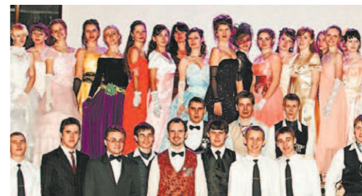
Молодежь Орла окуналась в атмосферу XIX века

28 ноября, чтобы попасть на «Осенний бал», орловская молодежь оделась в вечерние платья и фраки.