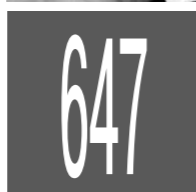
647 преступлений, связанных с незаконным оборотом наркотиков, зарегистрировано за 10 месяцев 2012 года в Орловской области