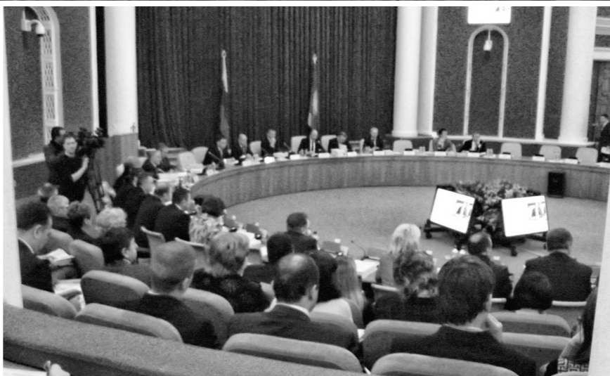
14-е заседание облсовета отличал деловой настрой собравшихся

Ряд законов депутаты облсовета приняли в первом чтении для дальнейшей работы над ними в комитетах. Поддержаны также ряд федеральных проектов, в том числе предложенные партией «Единая Россия» поправки к федеральному закону об образовании в РФ, и новая инициатива Правительства России — проект закона «О государственном стратегическом планировании».