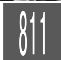
811 потребителей наркотических средств и психотропных веществ зарегистрировано на 1 ноября 2012 года в Орловском наркологическом диспансере

В 2011 году мы из своих рядов уволили шесть человек, замеченных в незаконных операциях с наркотиками. Смешно смотреть некоторые западные фильмы, где конфискующие «товар» со знающим видом его пробуют. На самом деле, к наркотику даже прикасаться без перчаток нельзя.