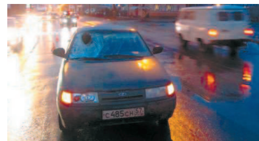
Пешеходный переход — зона особого внимания для водителя

Утром 30 ноября в Орле на улице Карачевской 23-летний водитель ВА3-2112 сбил женщину на пешеходном переходе.