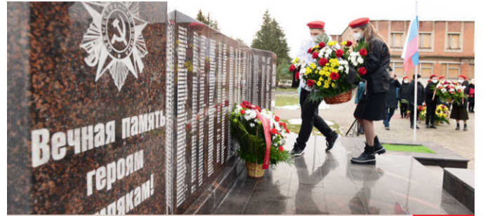
Земля заботы нашей