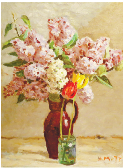
Натюрморт «Сирень», 1973 г.

традиций русского реалистического искусства, Николай Моревский большое место в своём творчестве отводил натюрморту, в котором и раскрылась вся красота живописи художника. Его картины и до наших дней сохраняют све-