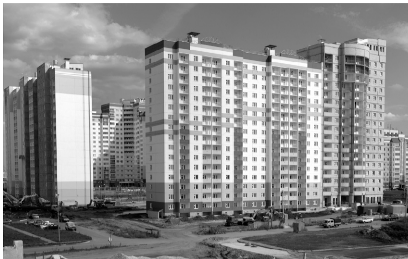
В 2016 году в области построено свыше 350 тыс. кв. м жилья