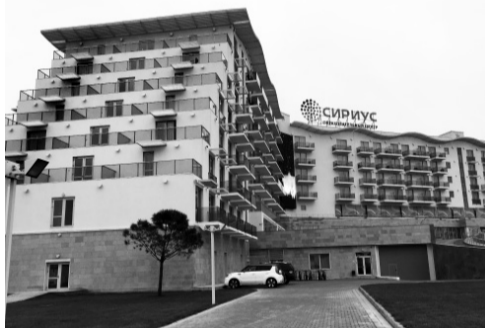
«Сириус» — это круто!