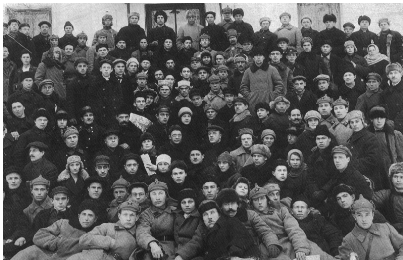
Участники I окружного совещания рабселькоров (1929 г.)