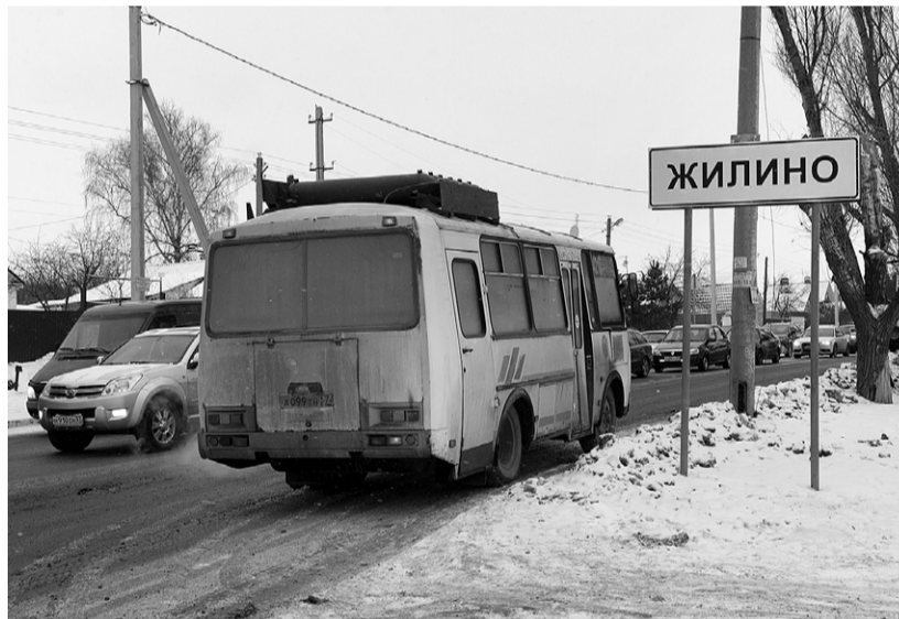
Маршрутки проезжают мимо...

Два года назад, как сообщают авторы письма в редакцию, «при установке новых столбов уличного освещения знаки «Остановка» были сняты у домов № 73, у которого даже сделан заездной карман, и № 50 да так и не возвращены обратно. С начала 2016 года водители маршруток, следующих в сторону Мезенки, отказываются останавливаться на «Второй Костомаровке» в обоих направлениях, как у дома № 73 в сторону Орла, так и напротив дома № 50. Свой отказ они объясняют запретом ГИБДД, которое в свою очередь руководствуется неким недавно принятым законом, по которому остановки запрещены».