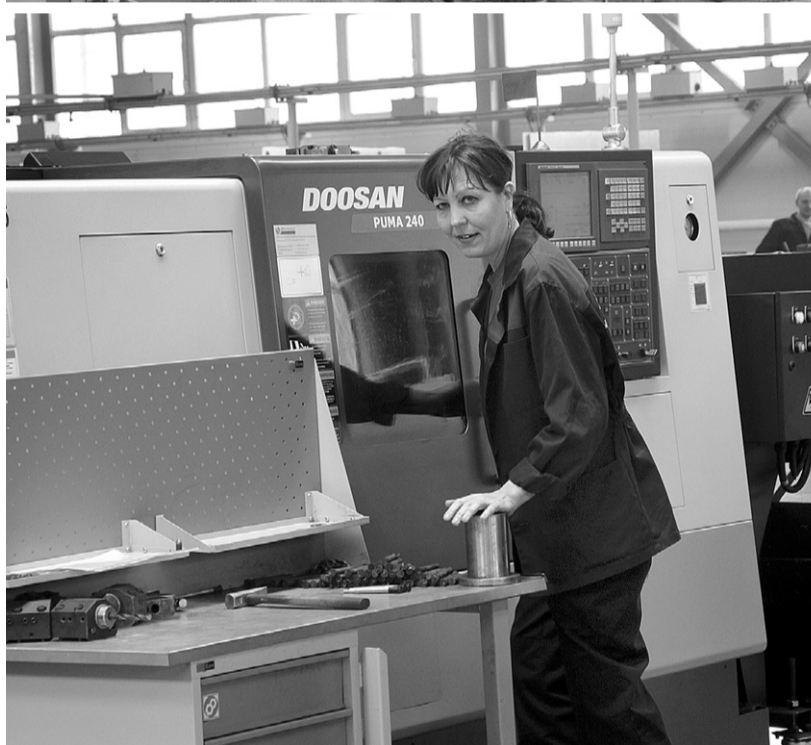
Ведущие предприятия активно вкладывают деньги в модернизацию производства

вую очередь эффективная работа. Это касается тех же промышленных производств. В добавление к уже сказанному назову ещё одну цифру. Десять ведущих предприятий отрасли готовы вложить в развитие и обновление собственной производственной базы