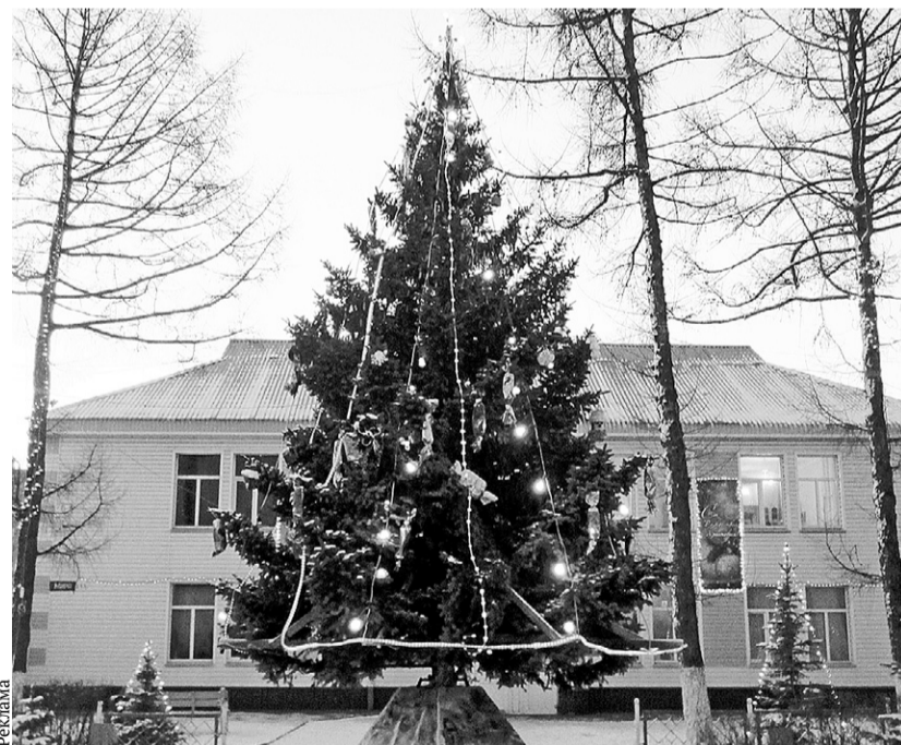
Новогодняя крутящаяся ель у входа в «Гидромашжилсервис» — самая нарядная в городе