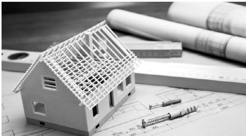
Малоэтажное строительство — перспективное направление

— На сегодня полностью израсходовано 120 млн.