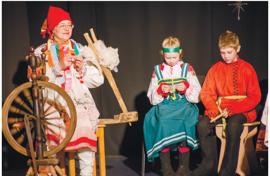
Предания старины глубокой

Этот фестиваль, проводимый Управлением культуры и архивного дела Орловской области и Орловским областным центром народного творчества, каждый год демонстрирует, насколько любимы и хранимы на Орловщине традиции старинного народного праздника.