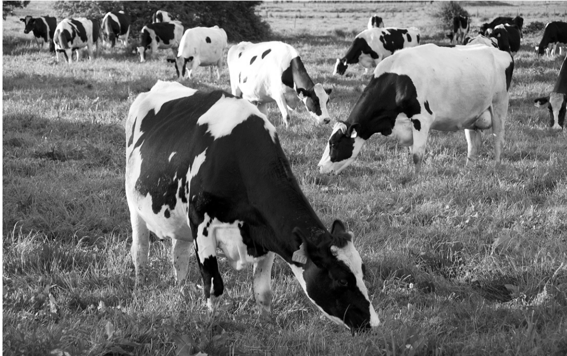
Молочное скотоводство нуждается в господдержке

В законе об областном бюджете на 2017 год и плановый период 2018–2019 гг. финансирование по направлениям господдержки орловских аграриев предусмотрено 2 млрд. 670 млн. рублей, из них почти 185 миллионов — средства областного бюджета. Орловщине запланирована господдержка из федерального бюджета по таким направлениям, как достижение целевых показателей региональных программ