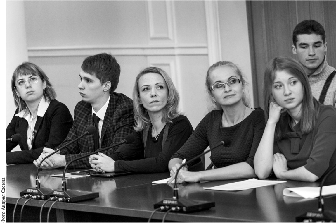
Дорогу — молодым

Молодые орловцы, мечтающие стать депутатами молодёжного парламента региона, представили свои проекты