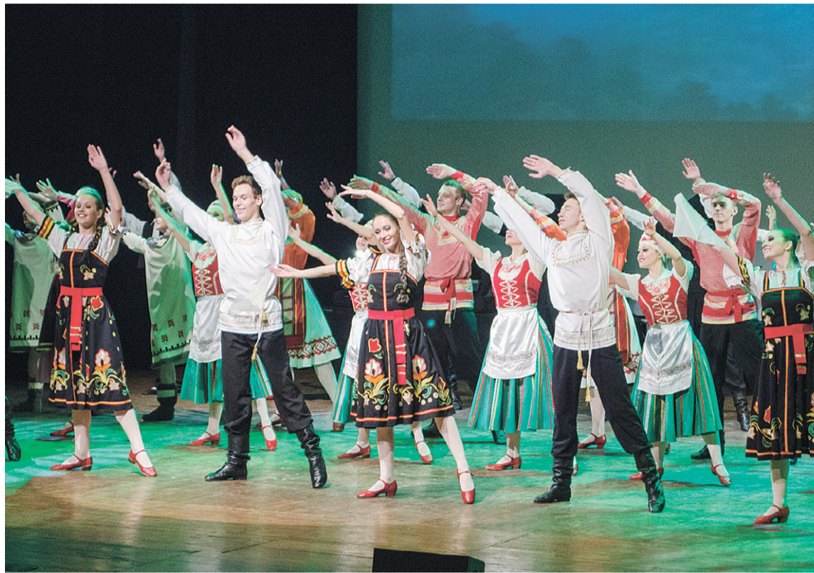
Всероссийский конкурс русского танца «Храним наследие России»