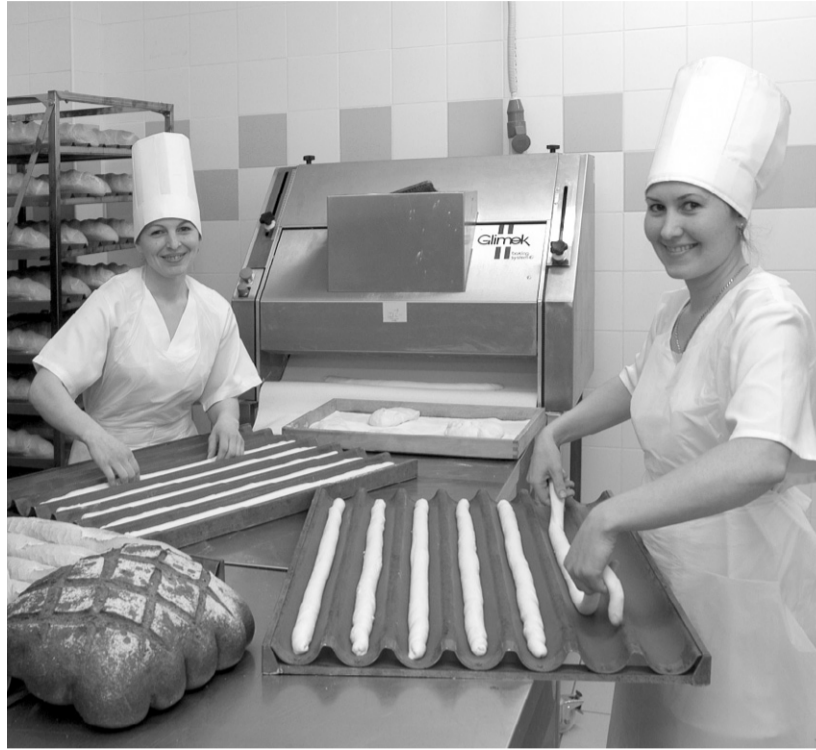
Малый бизнес — двигатель экономики

— Открытие новой дискуссионной площадки — ещё один шаг по улучшению инвестиционного климата в регионе, укреплению взаимного доверия между властью и бизнесом, — сказал он, подкрепив свои слова цифрами: из 137 заявлений на согласование внеплановых проверок предпринимателей, поступивших в прокуратуру области из контролирующих органов с начала года, по 74 было отказано.