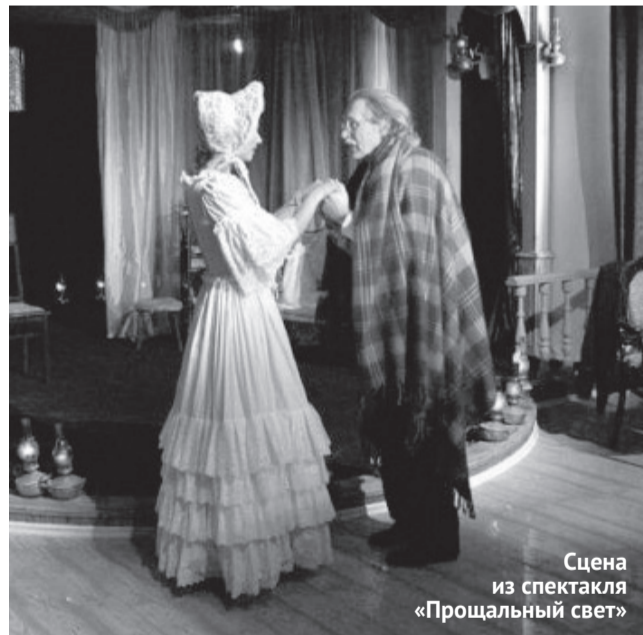
Сцена из спектакля «Прощальный свет»