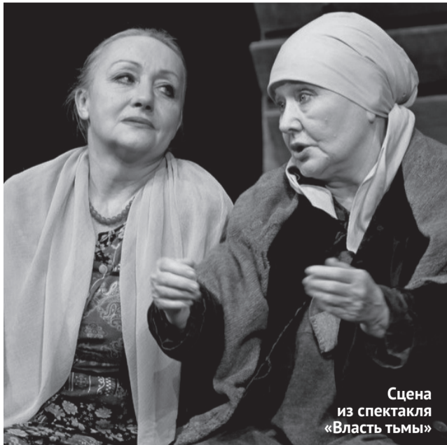
Сцена из спектакля «Власть тьмы»

« Главной традицией театра со времён его создания было уважительное отношение к классической литературе, представителей которой Орёл дал очень много. »