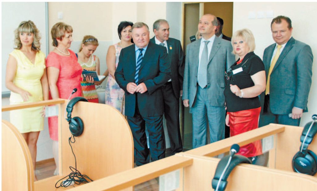
При посещении лингафонного кабинета школы №50 в микрорайоне Наугорский