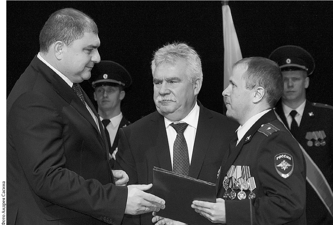
Губернатор Орловской области Вадим Потомский: — Правительство области видит в представителях силовых структур неизменных помощников и соратников

— Не секрет, что работа полицейского — это каждодневный, тяжёлый, самоотверженный труд, цель которого — обеспечить покой и безопасность граждан, соблюдение законности. Мужество, честность, решительность, высокая правовая грамотность — это те качества, которые позволяют сотрудникам полиции успешно исполнять возложенные