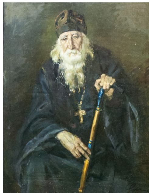
О. Сорокина. «Путник». 2016 г.

ля», и словно оживают древние монастырские стены в работе Ирины Ногинной «Болхов. Жизнь в монастыре».