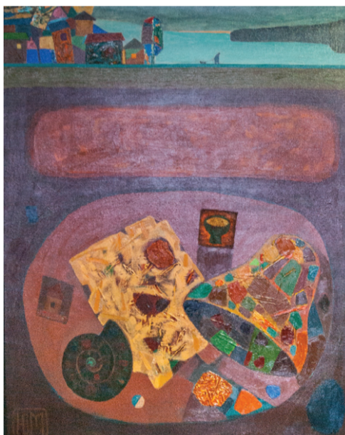
Ю. Мухин. «Недра». 2016 г.