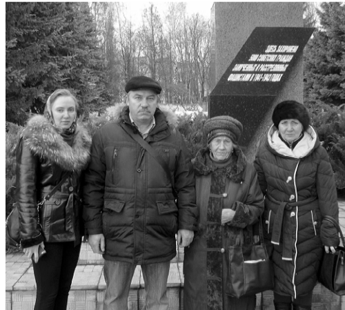
Родственники пропавшего солдата отыскали его могилу