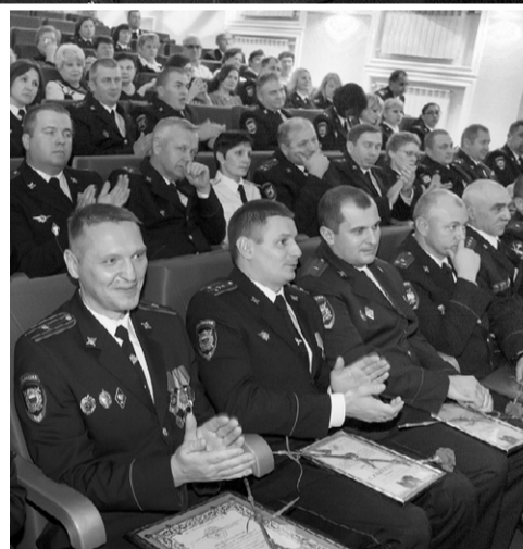
Их служба и опасна, и трудна

Затем состоялось торжественное награждение сотрудников полиции, добившихся высоких результатов в служебной деятельности. Медалью МВД России «За безупречную службу в МВД» были награждены замначальника УМВД Рос-