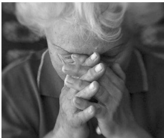
Рядом с чересчур доверчивым всегда объявится мошенник