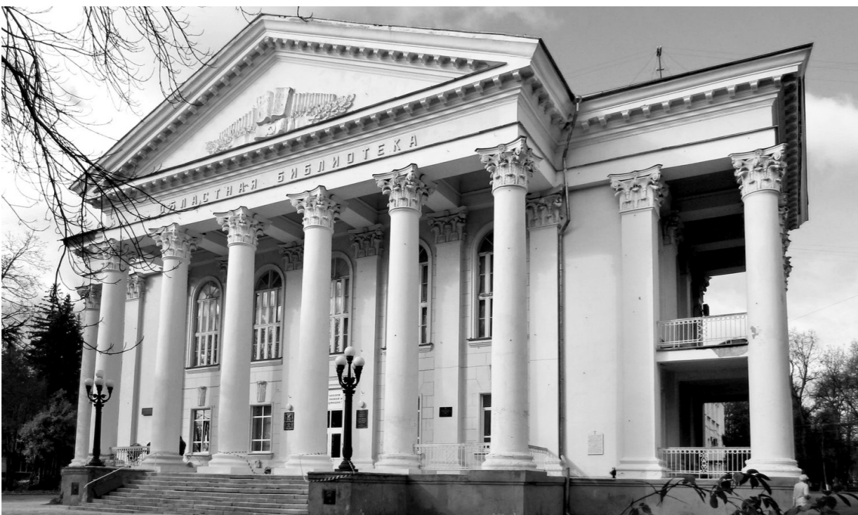
Вопрос реконструкции библиотеки им. И. А. Бунина сдвинулся с мёртвой точки

В рамках заседания были рассмотрены проблемные вопросы функционирования ещё ряда важных социальных объектов. Один из них — детский технопарк «Кванториум» на территории городского парка культуры и отдыха. Как напоминает пресс-служба облсовета, в феврале этого года комитетом проводился круглый стол на базе учреждения, в ходе которого были выявлены недостатки капитального ремонта здания, в том числе и нарушения температурного режима. В мае комитетом рассматри-