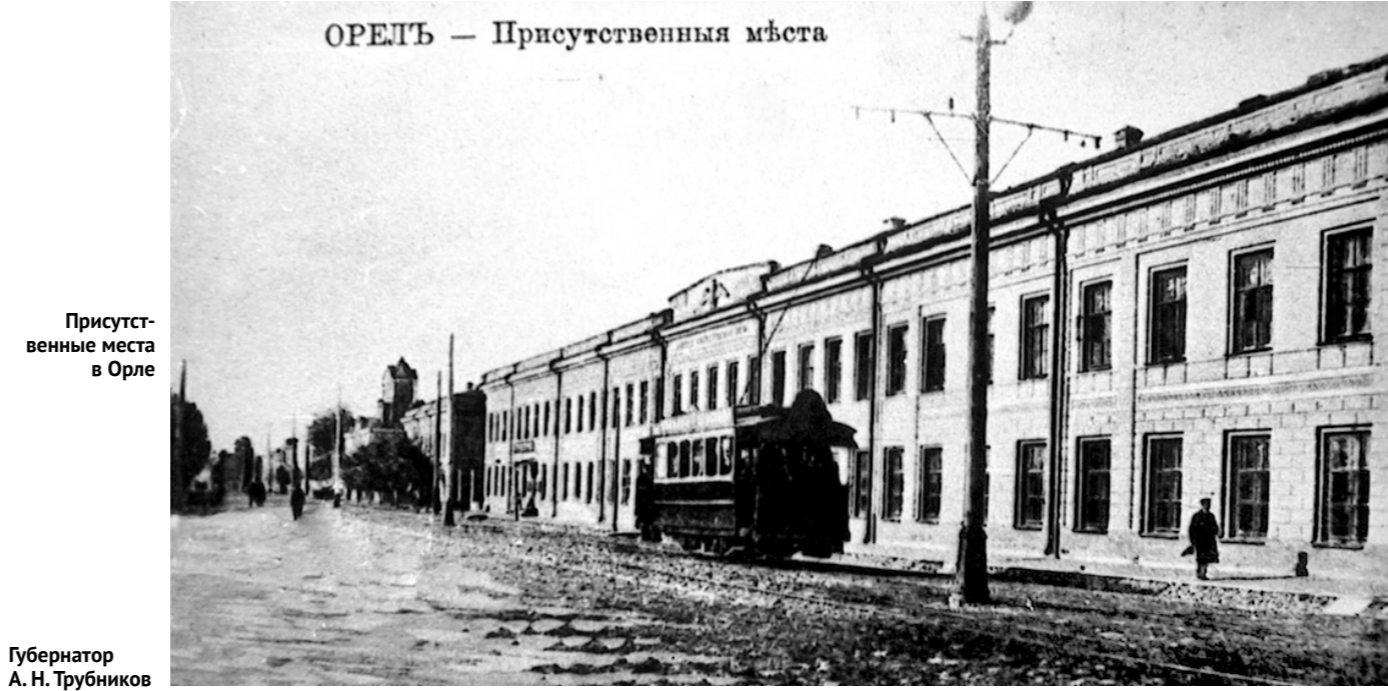
Присутственные места в Орле