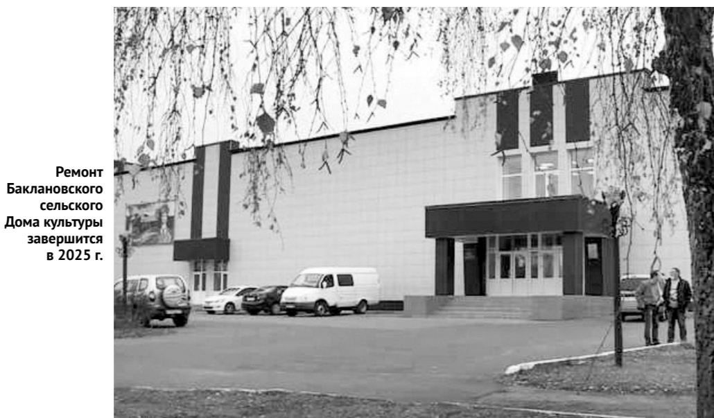
Ремонт Баклановского сельского Дома культуры завершится в 2025 г.

валось контрольное мероприятие КСП Орловской области, в результате которого установлены нарушения и недостатки.