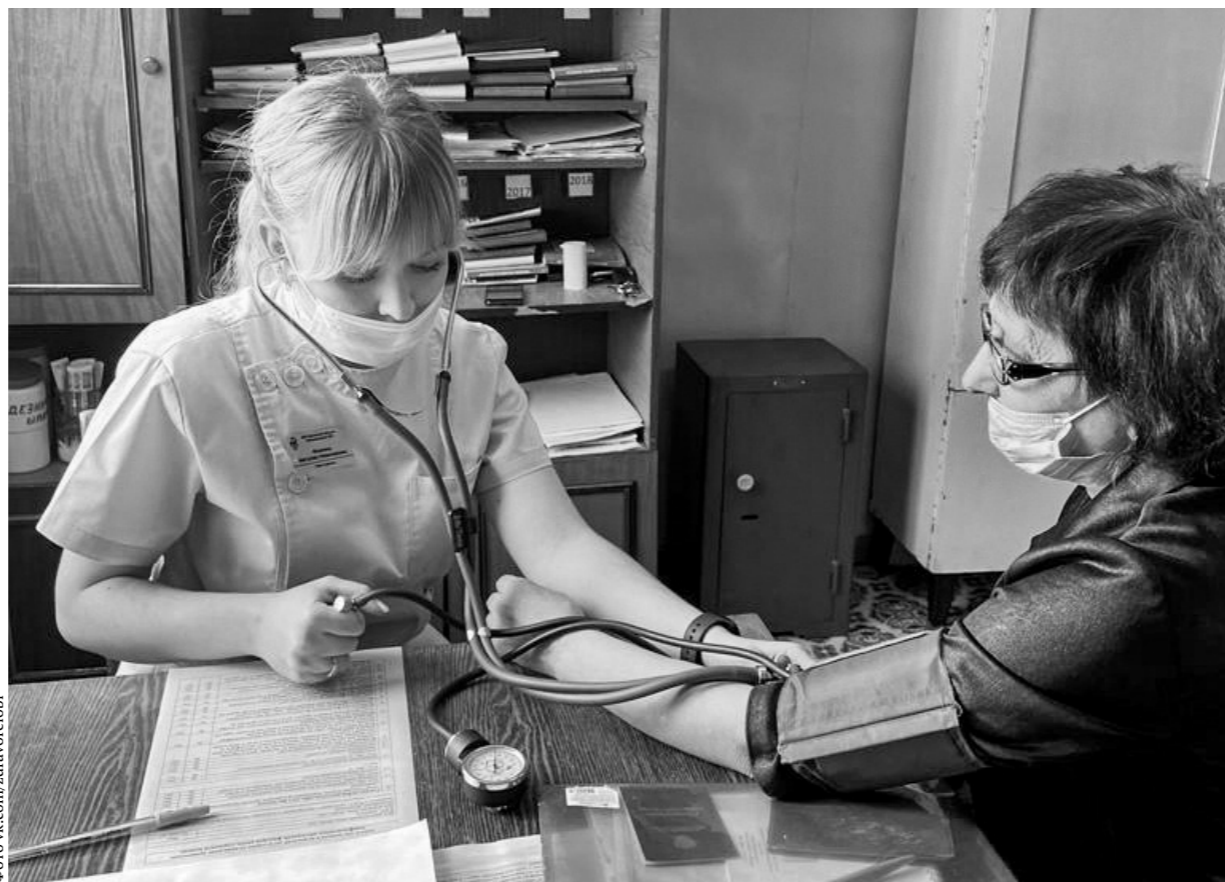
На приеме у терапевта

В ходе создания единого цифрового контура в здравоохранении на основе единой государственной информационной системы здравоохранения (ЕГИСЗ) в 47 учреждений развернута медицинская информационная система, произведена радикальная модерни-