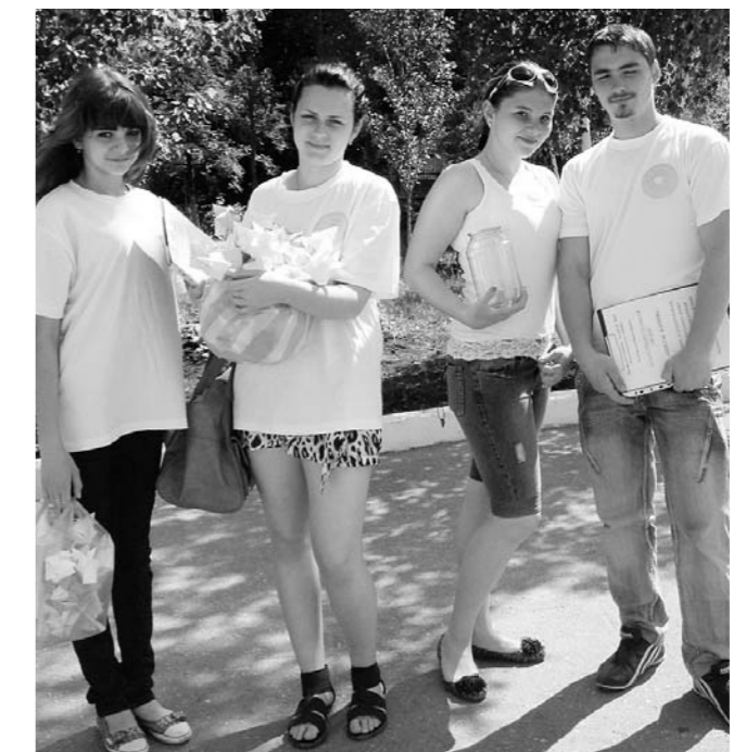
Члены клуба волонтеров «Данко»

пользуются новые подходы для достижения высокого качества образования, развитие научно-технического творчества студентов, создание системы научного сопровождения инноваций и т. д. Этим занимается Межфакультетский центр по изучению и внедре-