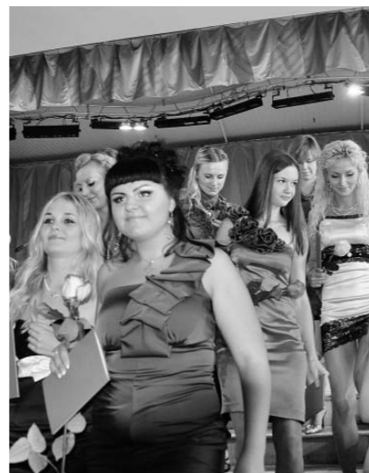
Вуз позади, жизнь — впереди!