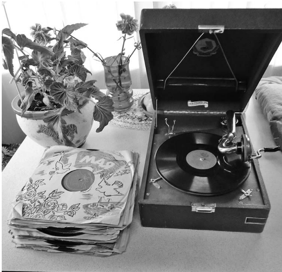
Спасибо судьбе за то, что мне с братьями и сёстрами родные дали возможность прикоснуться к этому волшебству

Бабушка нас успокоила, мол, точно, точно было напи-