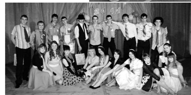
Участники конкурса «Мистер-2011»

пользуются новые подходы для достижения высокого качества образования, развитие научно-технического творчества студентов, создание системы научного сопровождения инноваций и т. д. Этим занимается Межфакультетский центр по изучению и внедре-