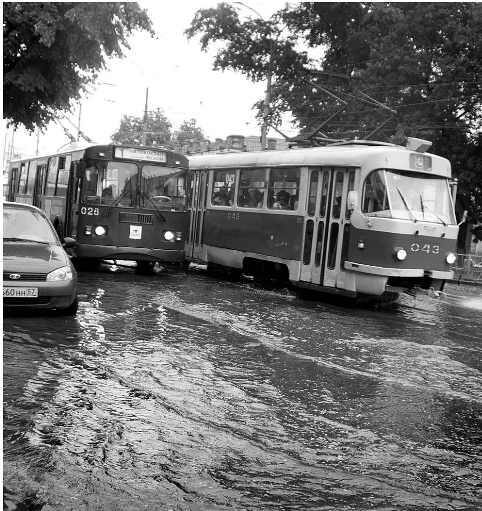
«Речной трамвайчик тихо встал у сонного причала...»

7 июля неисправные орловские ливневки парализовали движение. Трамвайно-троллейбусное предприятие подсчитывает убытки.