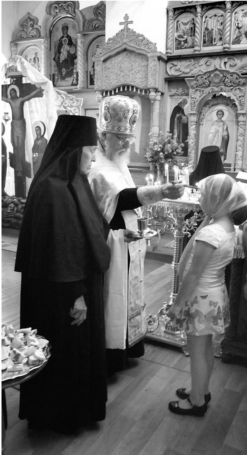
Свято-Введенский женский монастырь. Таинство миропомазания

Все мы помним фильм «Осенний марафон»... Мука — потому что это ненормально, не по-Божески. А чтобы вернуться к норме, нужно равняться на высокие примеры — такие, как Петр и Феврония, вдохновляться ими.