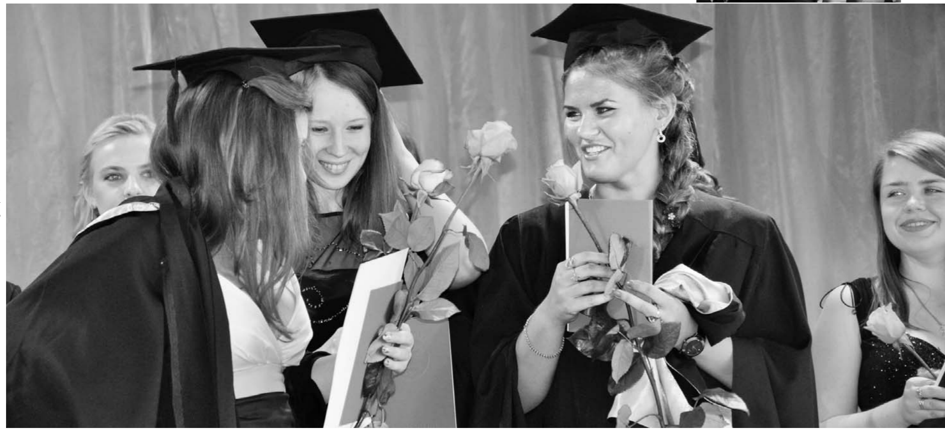
А у кого пятерок больше?