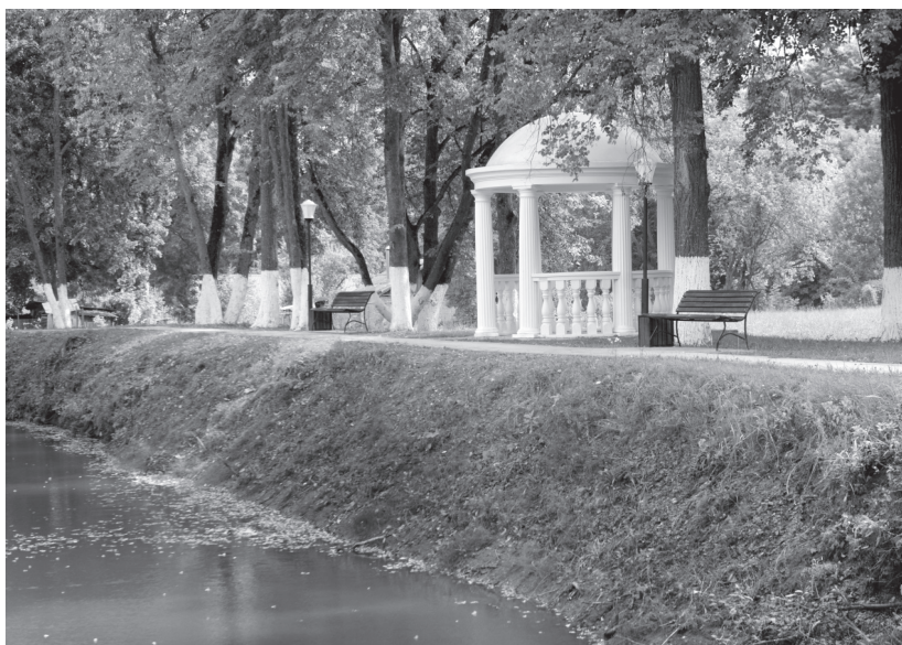
Перспективный проект — благоустройство усадьбы Шеншиных и прилегающей парковой зоны под Мценском

— Чтобы проголосовать, нужно зайти на онлайн-платформу, верифицироваться с помощью аккаунта на госуслугах и сделать свой выбор. Это займёт не более пяти минут. Процедура простая