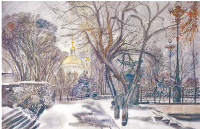
Ольга Тучнина. «Вид на храм Михаила Архангела»