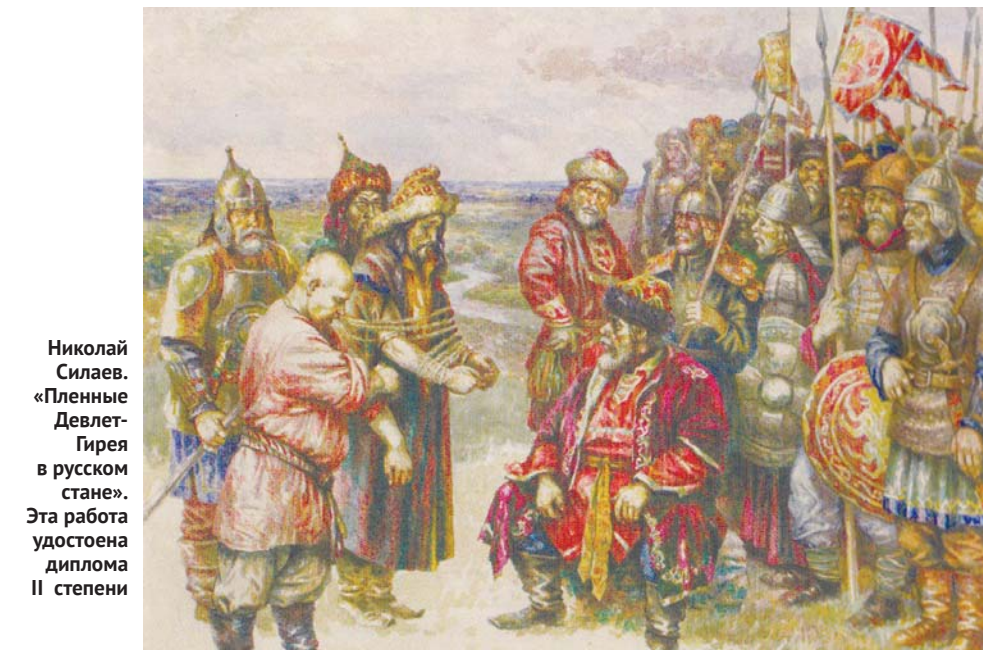
Николай Силаев. «Пленные Девлет-Гирея в русском стане». Эта работа удостоена диплома II степени

При всём уважении к иностранным авторам работы наших мастеров выгодно отличались выбором тем и проработкой сюжетов. Про акварель говорят, что она проста и сложна одновременно, что требует строгой и быстрой работы, поскольку автору надо постоянно следить, «как ведёт себя вода».