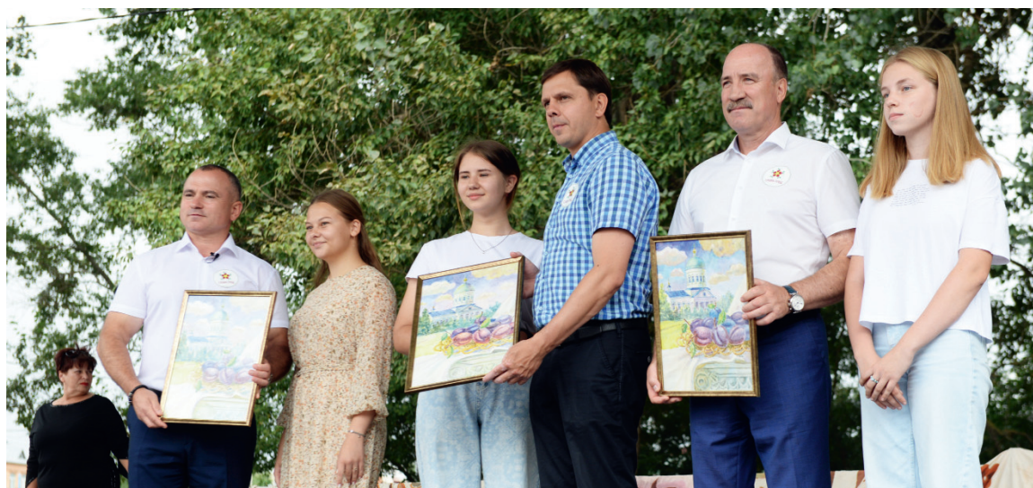
На картинах юных художников запечатлён новый праздник

Чуть позже на сцене состоялось торжественное театрализованное открытие фестиваля «Сказ про великий Слива-град»