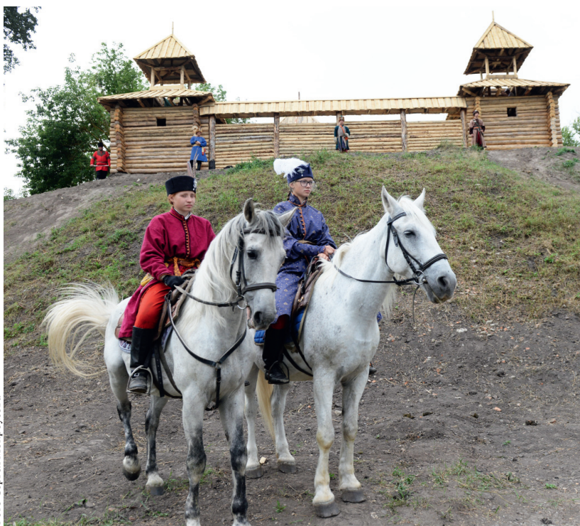
Кромская крепость — под надёжной защитой!

— Я очень рад, что на этом замечательном празднике собралось так много жителей района и области — сегодня в Кромском районе зарождается хорошая традиция! Надеюсь,