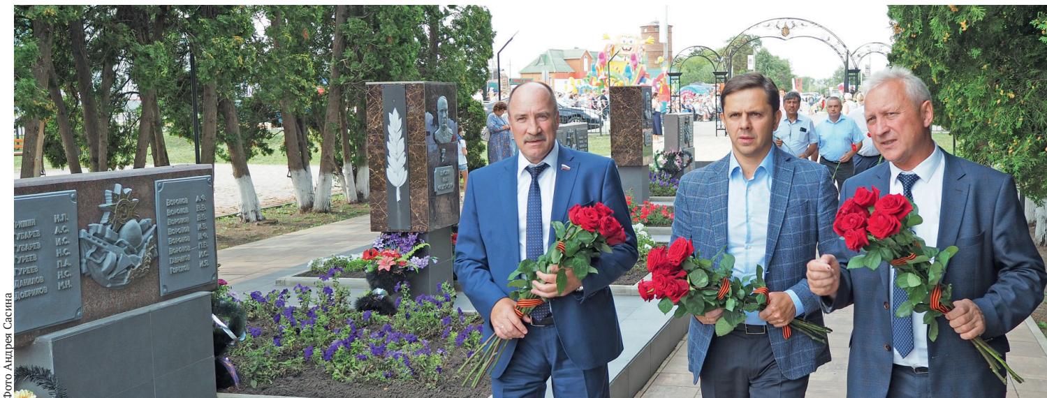
В сквере Памяти