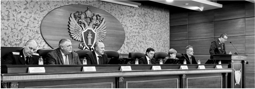
Орловская прокуратура подвела итоги работы в 2024 году.