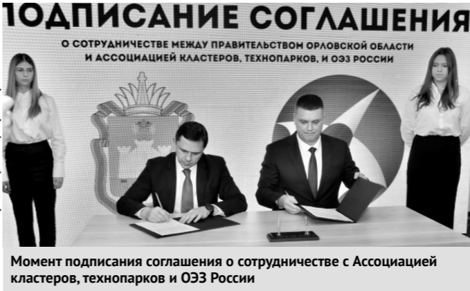
Момент подписания соглашения о сотрудничестве с Ассоциацией кластеров, технопарков и ОЭЗ России

— Помимо решения кадровых вопросов мы готовы поддержать инициативы наших предприятий по развитию кооперационных связей, организации промышленных кластеров. В Орловской области продолжается создание новых производственных площадок — прежде всего в особой экономической зоне «Орёл» и на территории опережающего развития «Мценск». Значительную поддержку предприятиям оказывает областной Фонд развития промышленности. Создан новый индустриальный