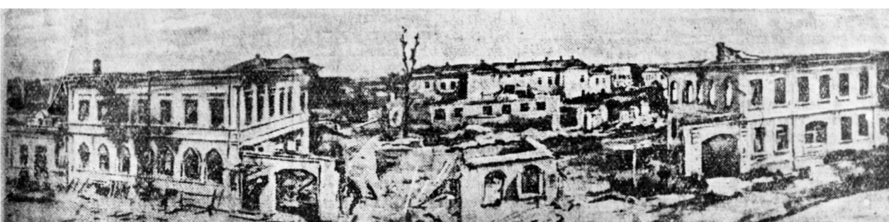
В освобождённом Мценске

Дивизии 3-й армии Брянского фронта генерала Горбатова прочно закрыты дороги, идущие из Орла в Тулу и Москву, не допуская прорыва противника в этом направлении. Части дивизий, ведя