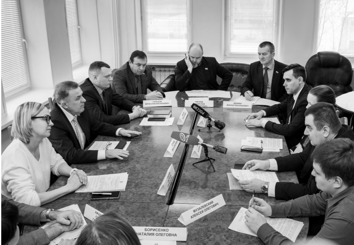
Депутаты областного Совета обсудили актуальные вопросы в сфере информационной политики и трудовых отношений