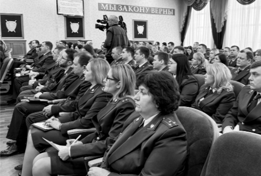
Сотрудников прокуратуры поблагодарили за высокий профессионализм, верность долгу и служение Родине

В результате эффективного взаимодействия с органами власти на 53 млн. рублей увеличено региональное финансирование обеспечения жильём детей-сирот. По предложению прокуратуры принят закон Орловской области, предусматривающий дополнительную меру социальной поддержки детей, которые не реализовали право на получение жилья, в виде ежемесячной денежной компенсации расходов по договору найма жилого помещения.