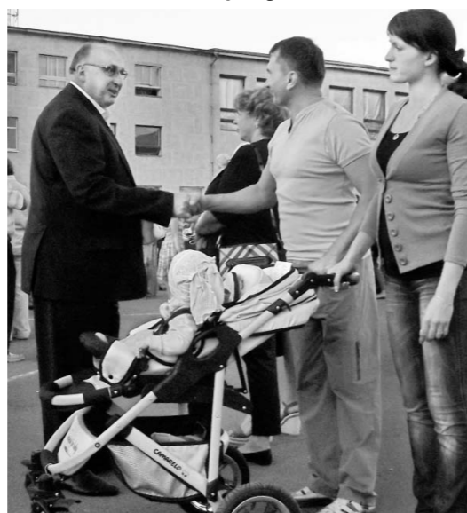
День освобождения Мценска от немецко-фашистских захватчиков

Думаю, было бы неплохо, если бы и другие чиновники были ближе к народу.