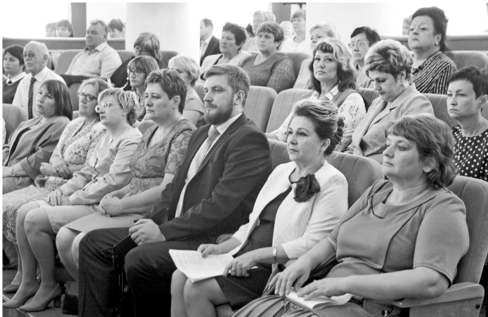
Орловские педагоги перед новым учебным годом «сверили часы»