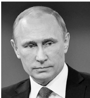
Владимир Путин, Президент Российской Федерации:

— Россия впервые проводила состязания лучших профессионалов планеты. Чемпионат стал самым крупным, зрелищным и представительным в истории движения. Участникам были созданы все условия для честной и справедливой борьбы, а также дружеского общения. К этому движению в России уже присоединились полмиллиона наших сограждан, но число его сторонников и участников неуклонно растёт. В нашей стране WorldSkills стало важнейшим элементом передовой системы профессионального образования, которую мы формируем в том числе по специальностям цифровой экономики. Мы меняем наши колледжи, создаём широкие, не имеющие аналогов в мире возможности для детей заниматься техническим творчеством. Отрадно, что наш опыт оказался востребованным.