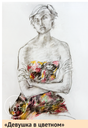
«Девушка в цветном»