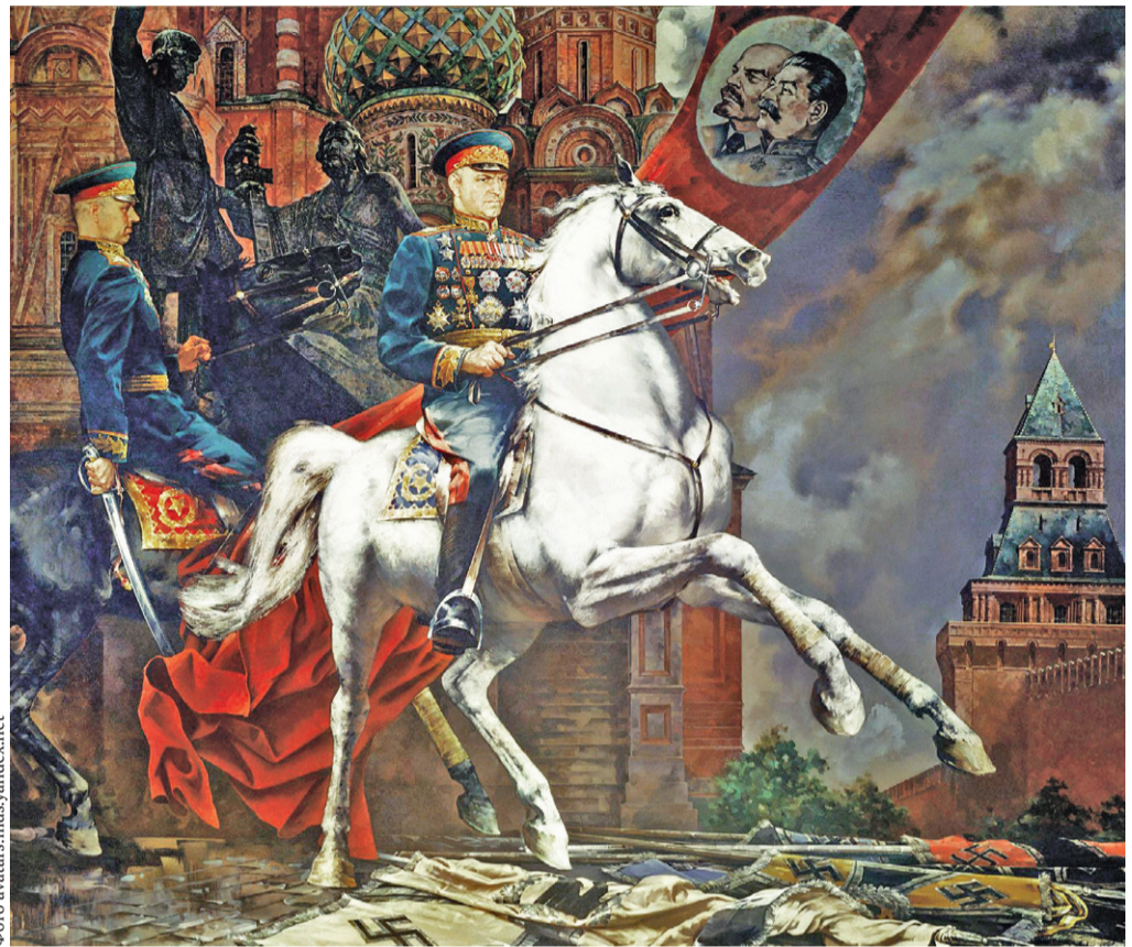
С. Н. Присекин. «Парад Победы»

На Ильинке часовня была, Русский князь был в серебряной раме, Про свои боевые дела Прихожанам твердил вечерами. Нет часовни, но князя слова Так и слышатся в сквере Танкистов, Потому что Россия жива, Словно дуб вековой, многолистый.