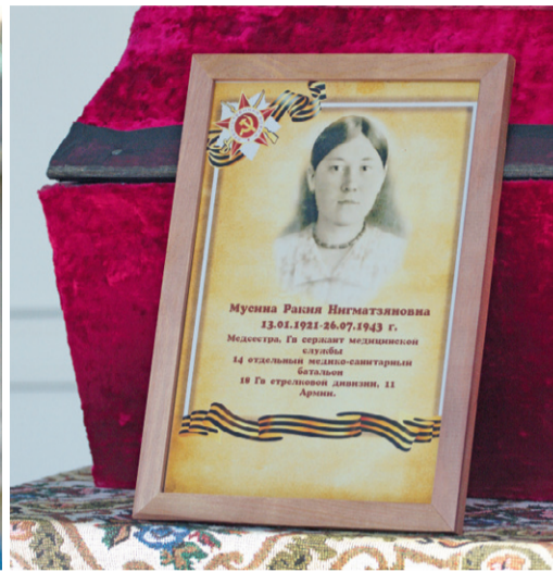
... Ей было всего 22 года