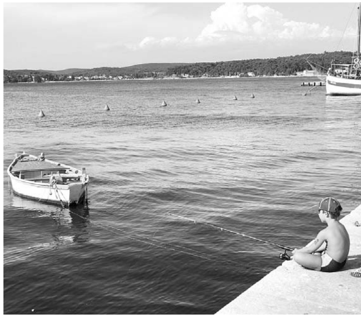
Фото Н. Тугова, г. Орел.

ЛУЧШИЕ СНИМКИ БУДУТ ПУБЛИКОВАНЫ. ЖДЕМ ВАШИХ ФОТОГРАФИЙ.