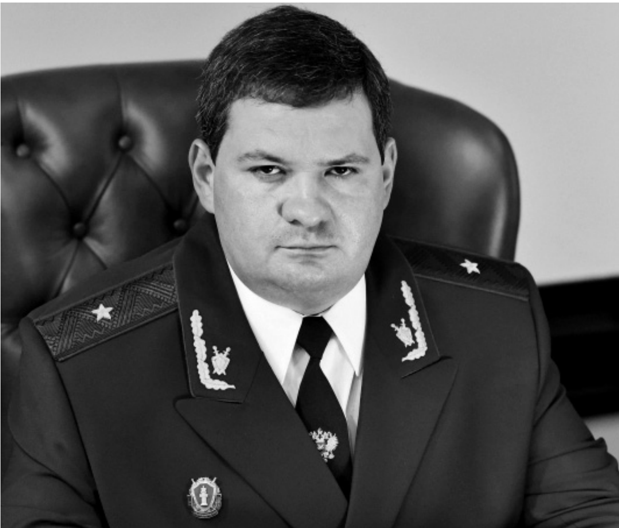
Владислав Малкин: — Коллектив прокуратуры области — команда хороших профессионалов

Владислав Малкин подчеркнул, что особое внимание уделяется вопросам качества предоставляемого детям-сиротам жилья; любым нарушениям в этой сфере будет дана жёсткая правовая оценка.