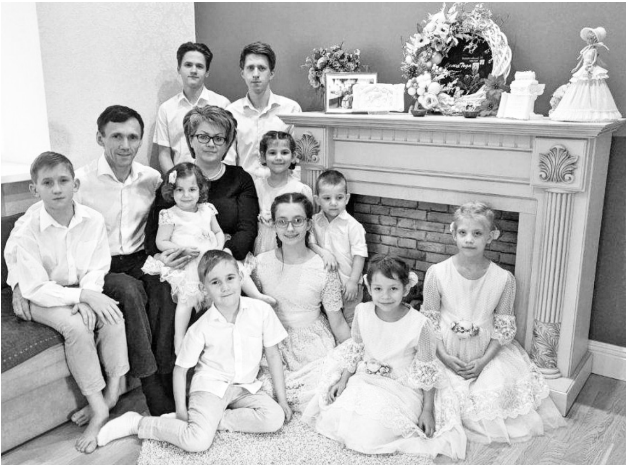
Семья вместе — и душа на месте