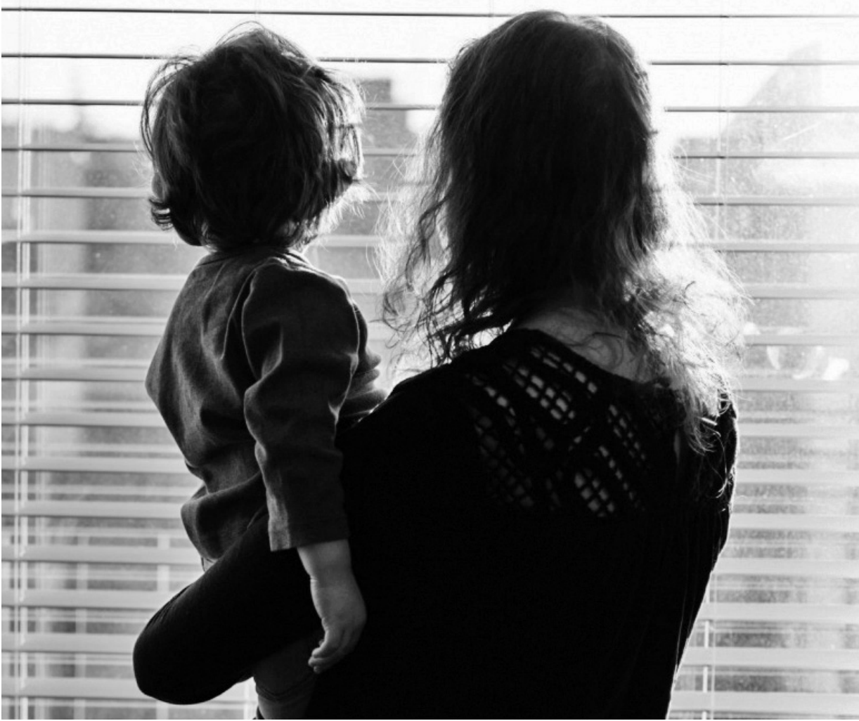
Следственный комитет провёл проверку, и питание стали выдавать, а затем вновь сбои...