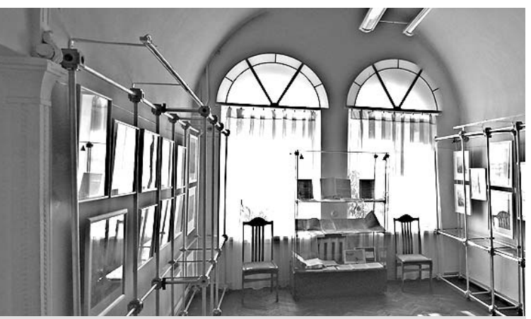
Зал музея с экспозицией, посвященной 70-летию Орловской области.

В период оккупации в годы Великой Отечественной войны Орловской области был нанесен огромный ущерб, который оценивался в 17 млрд. рублей, было разрушено 172 тыс. 650 домов. Особенно пострадали города Орел: были уничтожены промышленные предприятия, взорваны мосты и электростанции, выведены из строя водопровод и трамвай. Орел вошел в число 15 крупней-