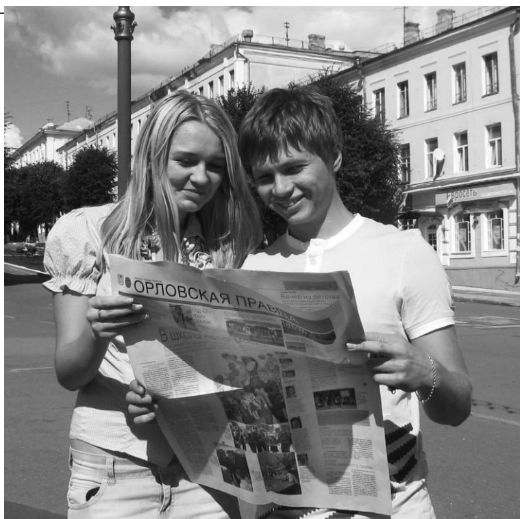
Напоминаем, что оформить подписку на 2-е полугодие 2011 года можно с начала каждого месяца.

6.00 Х/ф «Самолет летит в Россию». 8.00 «Тысяча мелочей». 8.20 «Медицинское обозрение». 8.30 Мультфильмы. 9.00, 10.25, 2.45, 4.20 Х/ф «Золотой теленок». 12.30 Шоу «Обмен женами». 13.30 «Самое смешное видео». 14.30 Д/с «Авиакатастрофы». 15.40 Х/ф «Марш-бросок». 18.00, 0.00 Х/ф «Киборг». 20.00 «Что делать?». 21.00 «Мама в законе». 23.00 «+100500». 23.30 «Голье и смешные». 1.50 Т/с «Морская полиция-6».