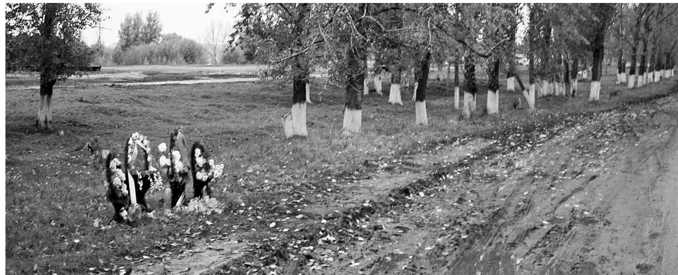
На место трагедии сельчане несут венки и цветы

— То, что я увидела, меня повергло в шок. Дети лежали