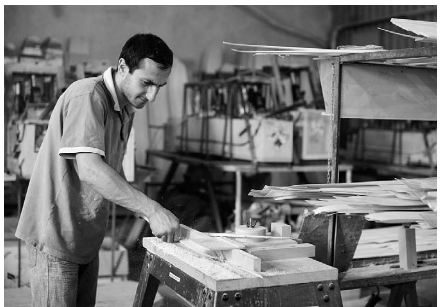
Сплошное наблюдение малого бизнеса — в интересах самих предпринимателей

Анкеты нынешнего сплошного наблюдения значительно упростились по сравнению с аналогичным обследованием 2010 года. Заполненные бланки наблюдения можно сдать нарочным, по почте или в электронном виде че-