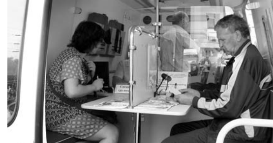
Всё популярнее становятся мобильные офисы службы занятости

Вопросы трудоустройства помогают решать орловцам также стационарные консультационные пункты — они располагаются в сельских и районных администрациях области, в органах соцзащиты. Например, центр занятости населения Дмитровского района организовал работу консультационного пункта на базе администрации Горбуновского