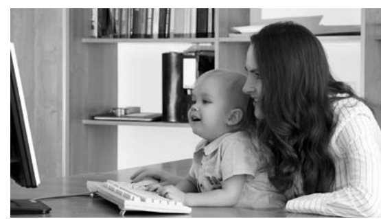
Рано или поздно «декретные каникулы» кончатся

В прошлом году по договору со службой занятости профессиональным обучением и допполнительным профессиональным образованием жен-