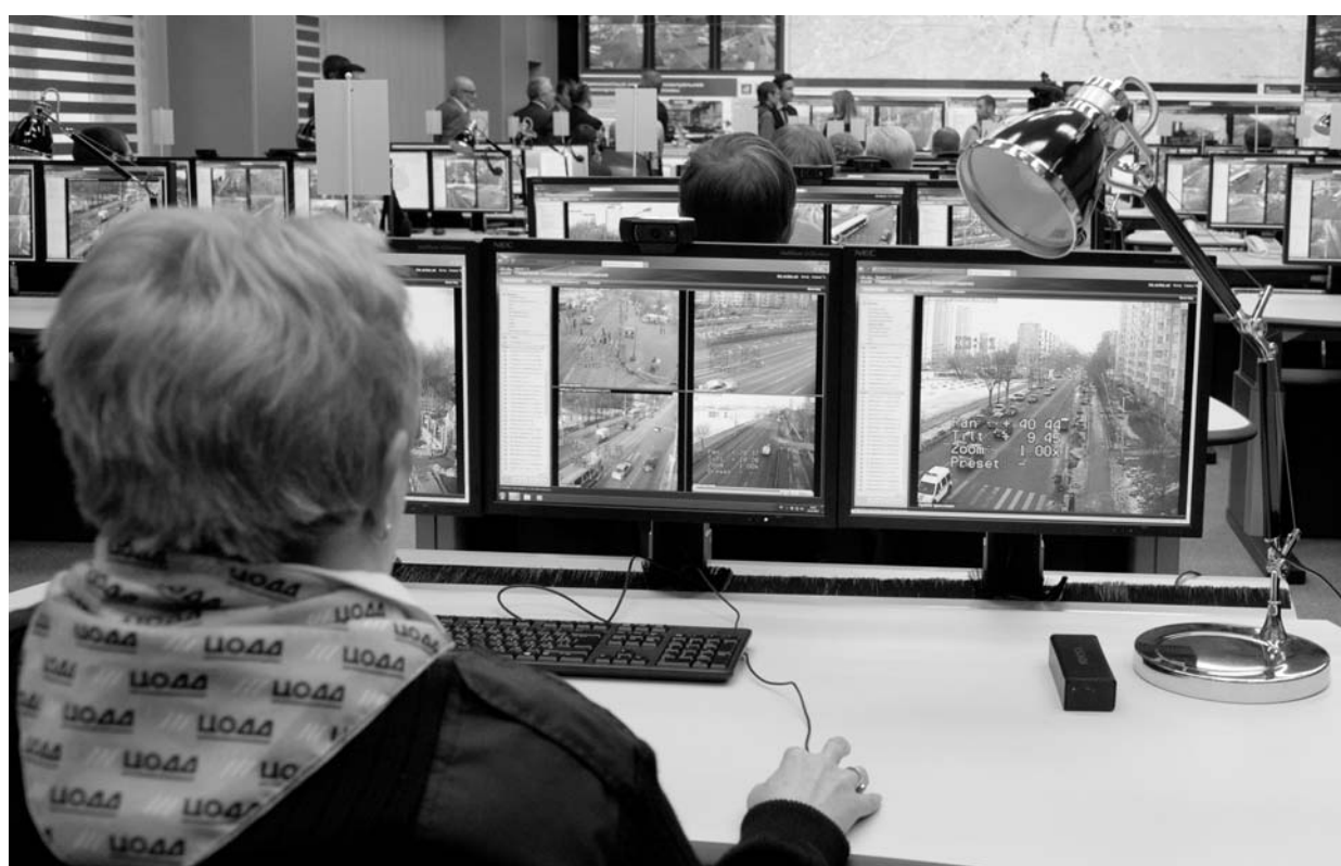
Использование спутниковых технологий ГЛОНАСС/GPS — уже реальность

Старт новым структурным форматам развития экономики Орловской области — кластерам — был дан в 2015 году созданием центра кластерного развития (структурное подразделение некоммерческой организации «Фонд поддержки предпринимательства Орловской области»).