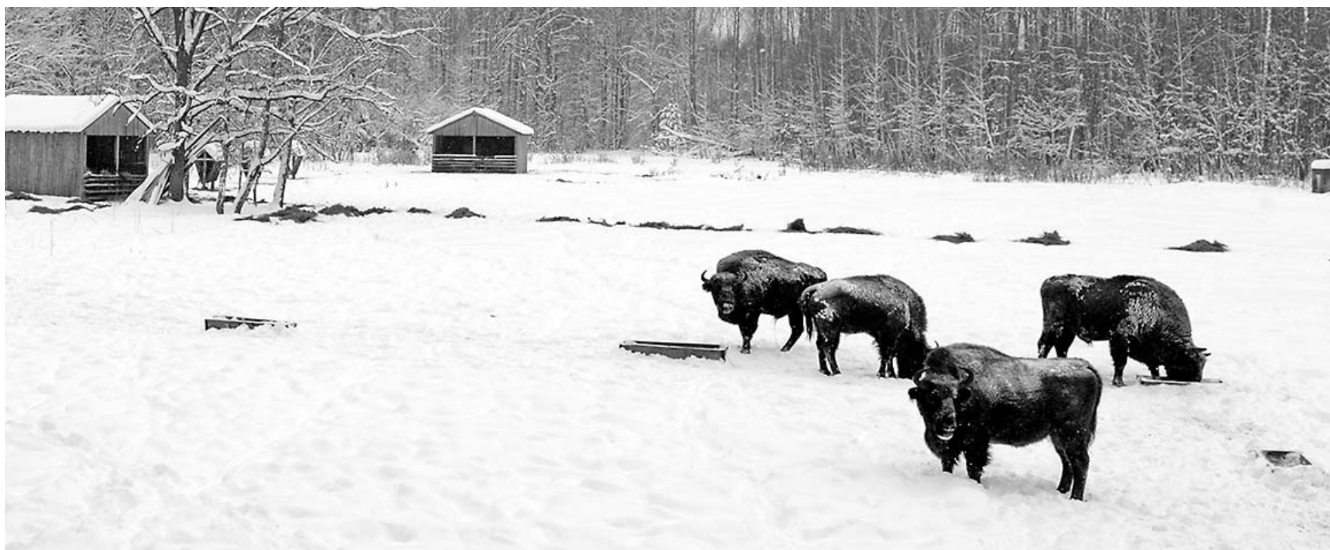
Увидеть стадо зубров в Орловском Полесье можно только зимой