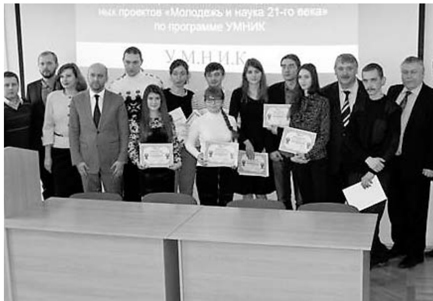
Победители регионального конкурса инновационных проектов «Молодёжь и наука 21-го века»

Развитие кластерных дивизионов поможет эффективному взаимодействию предприятий региона