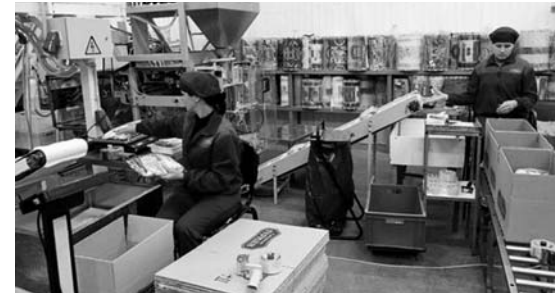
Работы для «общественников» хватает

В конце декабря 2015 года уровень регистрируемой безработицы в нашем регионе составил 1,2 %. На этой отметке он остаётся и сегодня.