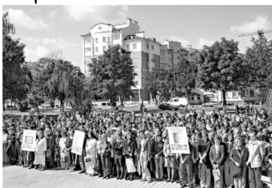
единство не сокрушить силами террора!

— Дорогие беслановцы, — обратилась к жителям североосетинского города от имени профессорско-преподавательского состава, от матерей ветеран вуза профессор О.Г. Сафронова, — мы все с вами вместе скорбим и преклоняем свои головы в знак памяти о погибших. Нас не сломить! Наша