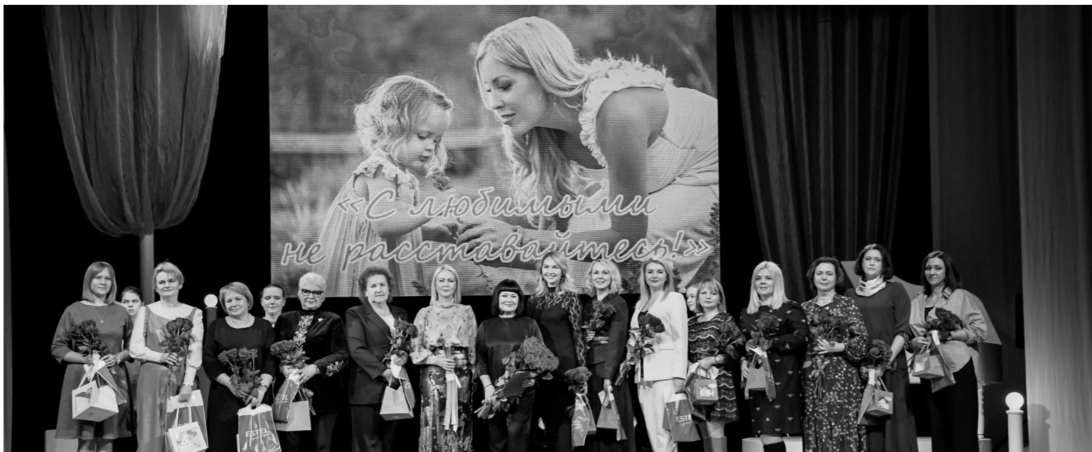
Главное признание – мама