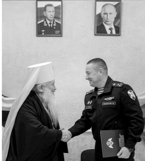
Русский народ побеждает благодаря силе духа и вере

Уже в следующем году у военнослужащих и сотрудников Росгвардии появится возможность обратиться к молитвам к православным святым, попросить покровительства и защиты, так необходимых в их ответственной и опасной работе.