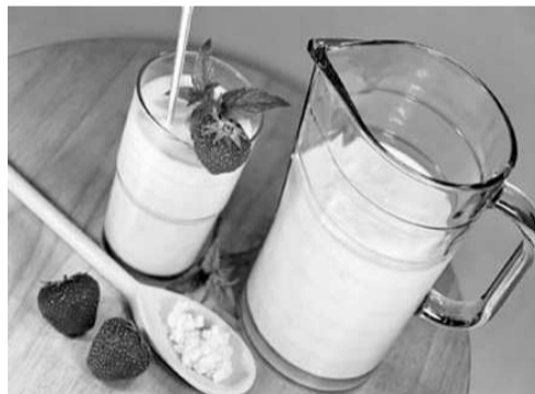
А кефир — только вспомогательное средство!

к кишечной стенке и образуют пленку, которая как перчатка покрывает кишечник изнутри. И вот через эту микробную пленку происходит всасывание в кровь всех веществ, находящихся в кишечнике. Микрофлора нейтрализует токсины и аллергены, которые могут находиться в кишечнике, вырабатывает пищеварительные ферменты, которые участвуют в процессах опорожнения, в обмене веществ, в иммунном ответе. У грудного ребенка все эти процессы находятся в стадии формирования, поэтому дисбактериоз у малышей неизбежен, даже если они находятся на грудном вскармливании. Влияют на появление дисбактериоза у ребенка такие факторы, как течение беременности и характер родов, стиль питания матери, ее болезни, прививки, прием любого лекарства, экология.