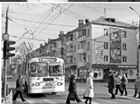
Орёл. Улица Максима Горького. Дом 50, где произошло убийство

Иван Кузнецов был неординарной фигурой. Родился в Туле в 1948 году. Первый раз сел еще подростком. По непонятным причинам считал себя героическим противником советской власти. Однажды он выкинул номер, от которого тульские партчиновники схватились за голову. В день рождения Брежнева он вышел на площадь Ленина, облил себя из канистры бензином ... но чиркнуть спичкой замедлил. В этот момент появились стражи порядка. Кузнецов