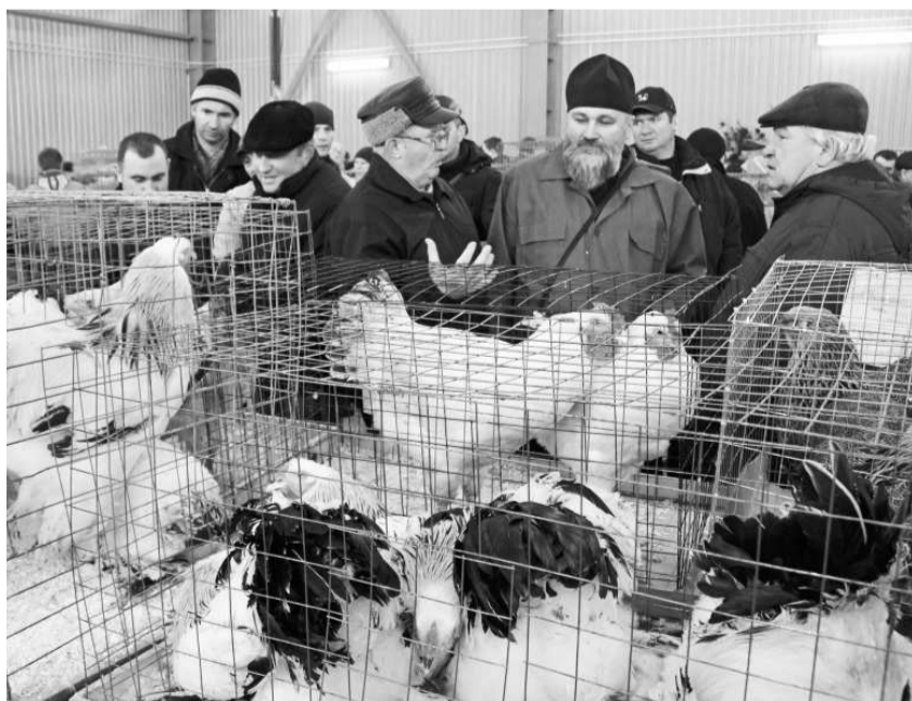
Выставка собрала более 150 участников