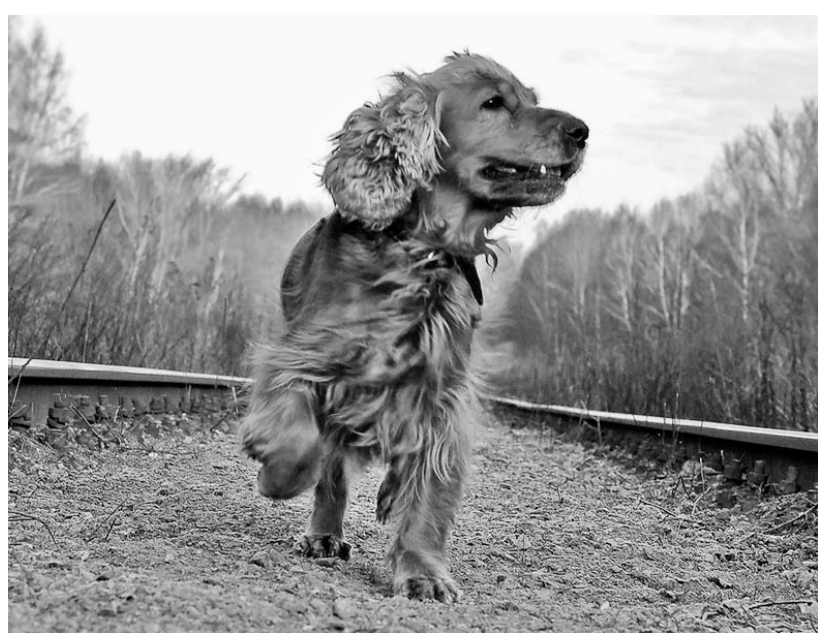
Фото К. Авдеева, г. Орел.

Наш адрес: 302000, г. Орел, ул. Брестская, 6, к. 33.