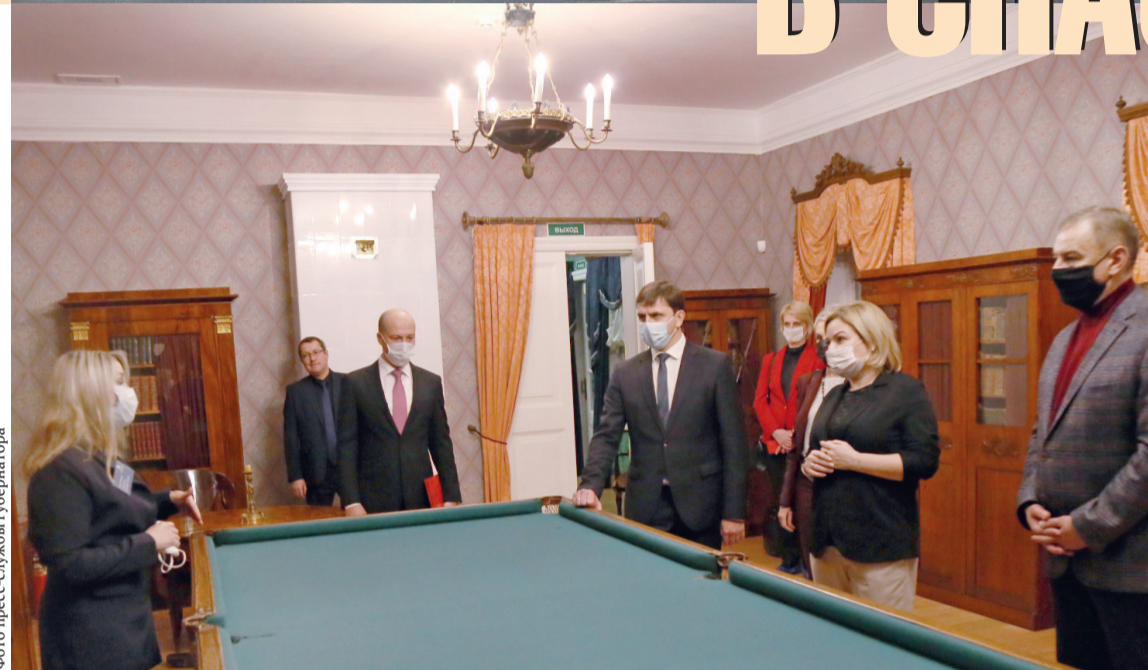
Министр культуры РФ Ольга Любимова высоко оценила проекты творческой команды Спасского-Лутовинова

— Такого музея в России нет, и мы уверены, что более подходящего места, чем Спасское-Лутовиново,