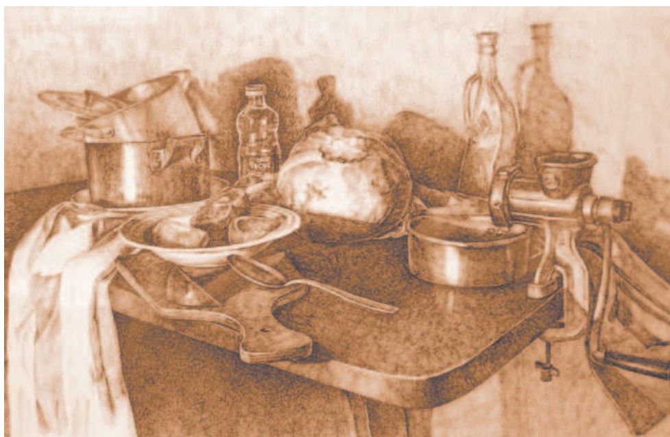
Неубранный стол - натюрморт, графика