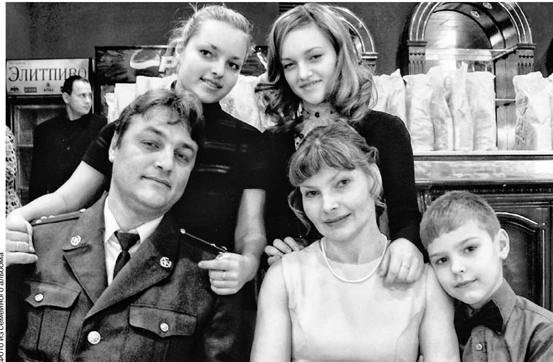
Фото из семейного альбома