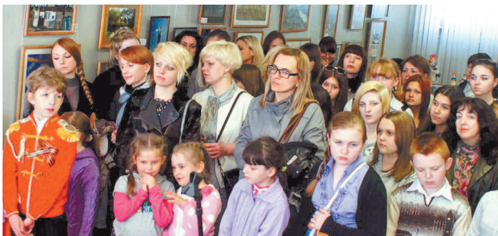
Юные конкурсанты на церемонии награждения

Что касается областного конкурса молодых православных художников «За Веру и Отечество», то он проходил по номинациям: «Православные святыни», «Иллюстрируем Библию», «Благословенно воинство», «Святые великомученики» (сцены из житий), «Пейзаж» (красота мира, сотворенного Богом). Выставка работ-победителей конкурса в этом году посвящена 900-летию памяти преподобного священномученика Кукши.