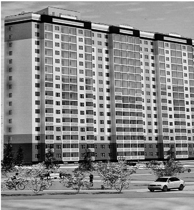
Таким будет дом нового поколения

Затем губернатор заложил капсулу в основание нового дома.