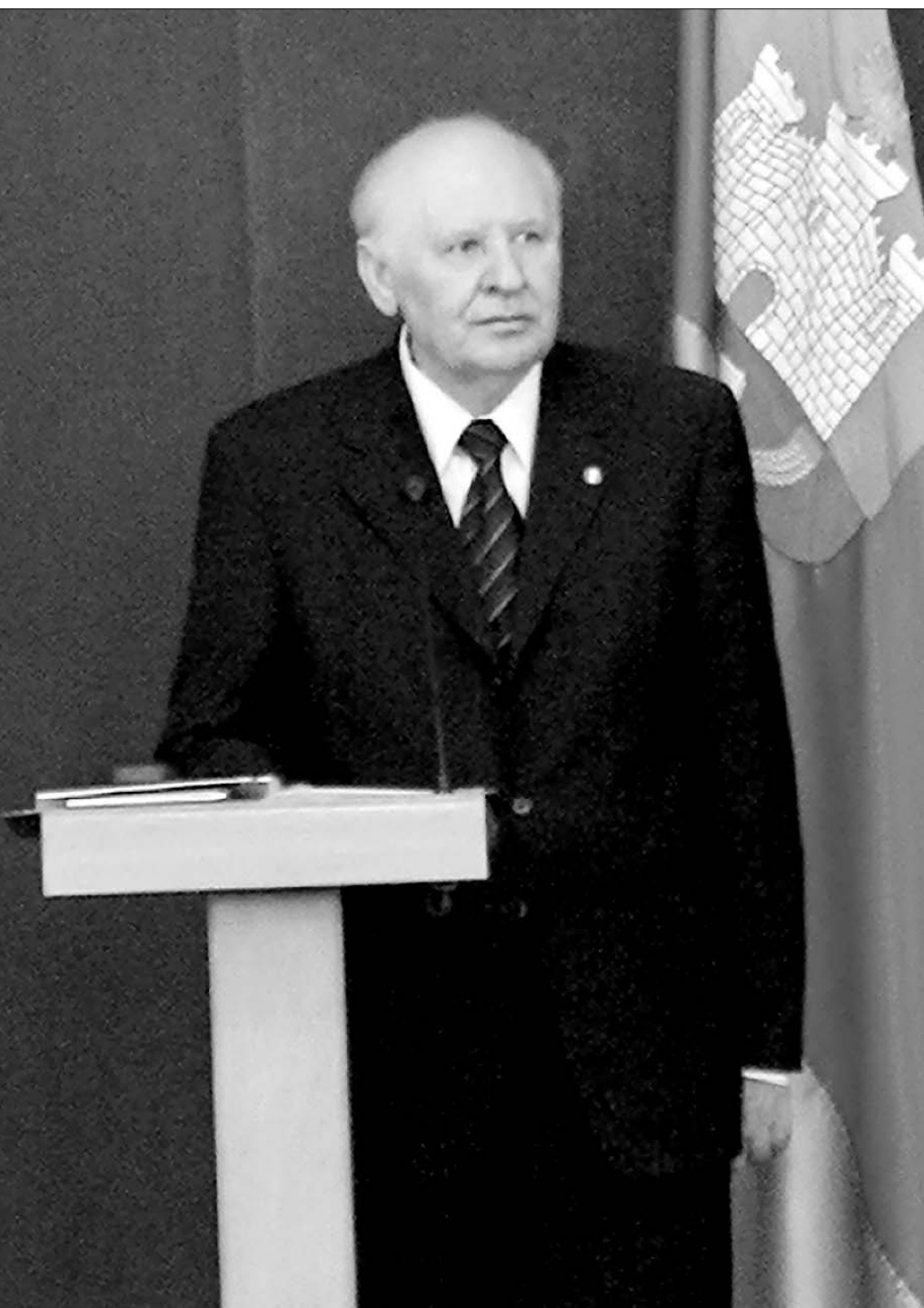
Фото Сергея МИРОНОВА.

С.М. МИРОНОВ. Председатель Совета Федерации Федерального Собрания Российской Федерации.