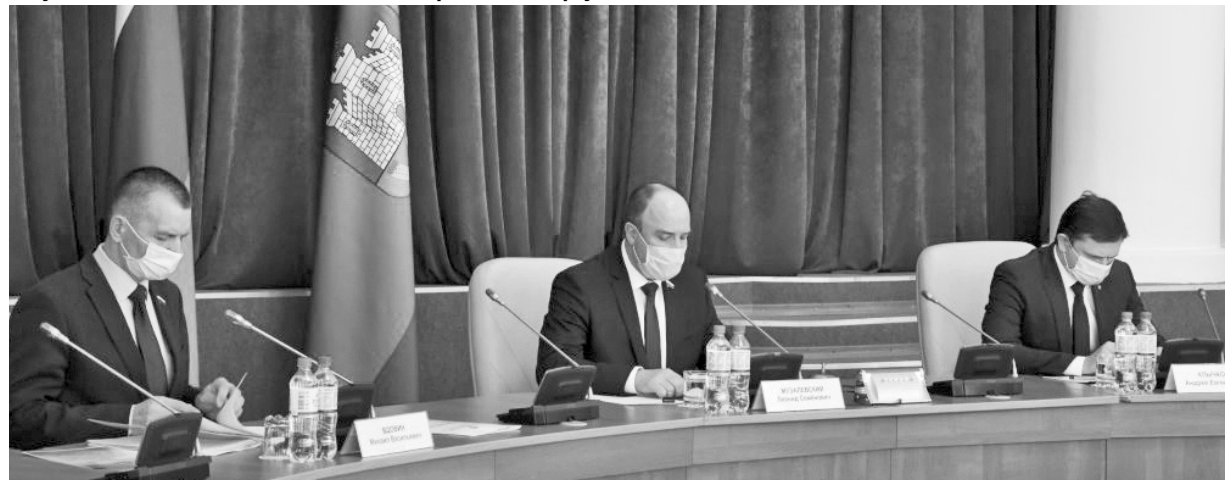
На апрельской сессии депутаты рассмотрели 16 вопросов

Орловские депутаты одобрили ряд мер по поддержке бизнеса в условиях пандемии коронавируса