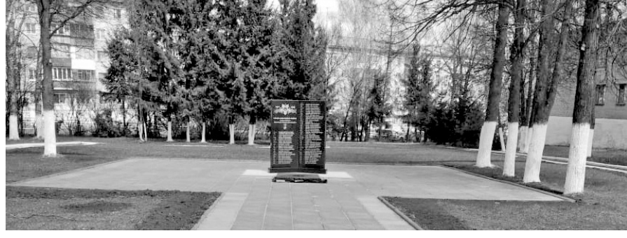
Память о воинах-победителях свято хранят в Отраднинской общеобразовательной школе

О своем участии в Вахте памяти мечтают и школьники