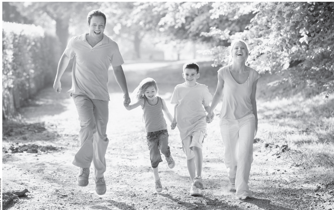
Главное — чтобы спорт был в радость

— Мне 70 лет, вторую неделю низкое давление — 110 на 58, слабость, бывает и головокружение. У меня есть онкологическое