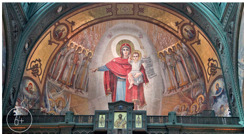
«Пресвятая Богородица — заступница земли Русской». Мозаика западной апсиды Главного храма Вооружённых сил Российской Федерации