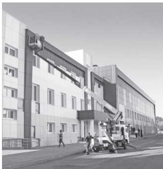
НАЦИОНАЛЬНЫЕ ПРОЕКТЫ РОССИИ ДЕМОГРАФИЯ

В Орле завершается реконструкция многофункционального спортивного комплекса «Победа».