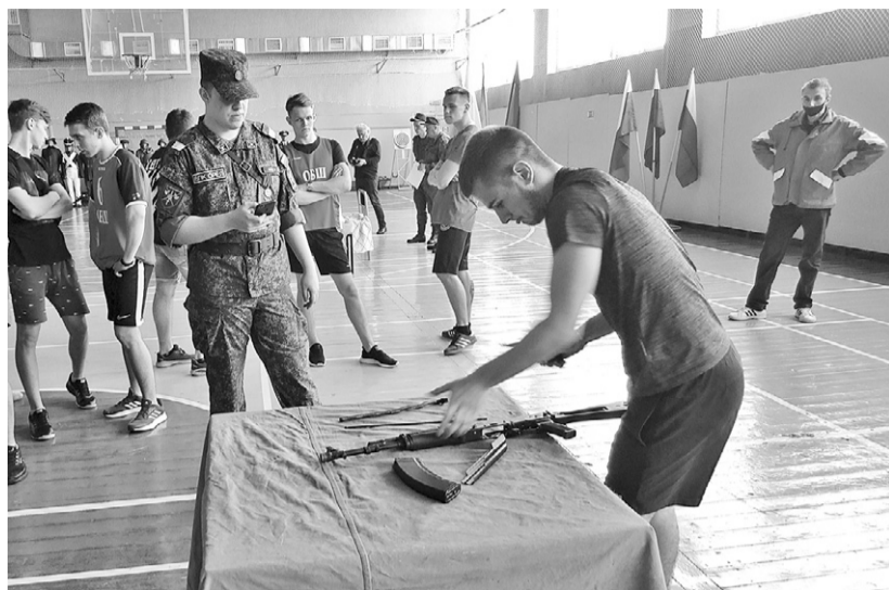
Момент соревнований: разборка и сборка автомата Калашникова

В рамках традиционной военно-патриотической акции с таким названием в спортзале Орловского городского центра культуры 17 мая прошло культурно-спортивное мероприятие, участниками которого стали будущие призывники.