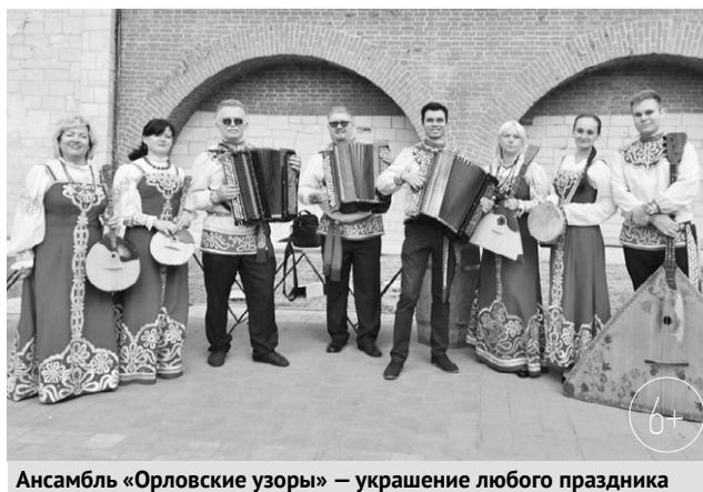
Ансамбль «Орловские узоры» — украшение любого праздника