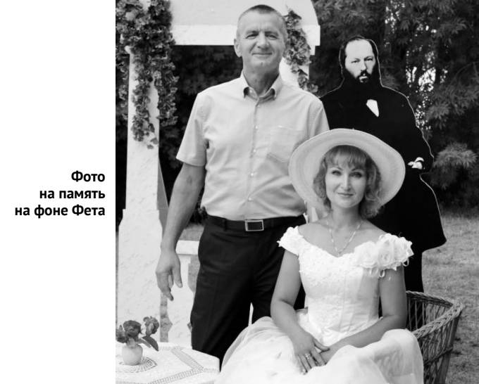
Фото на память на фоне Фета

Мы возьмём за уголки наши русские платочки!