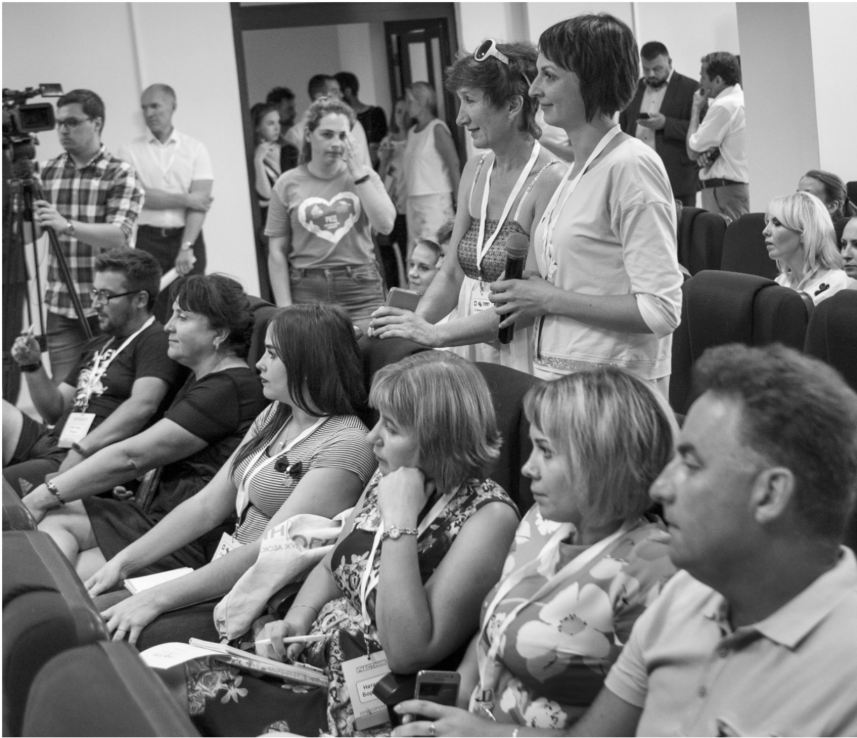
Представителям орловских СМИ форум дал богатую пищу для размышлений

Многие уже что-то знают и расширяют свой кругозор, другие открывают для себя новое.