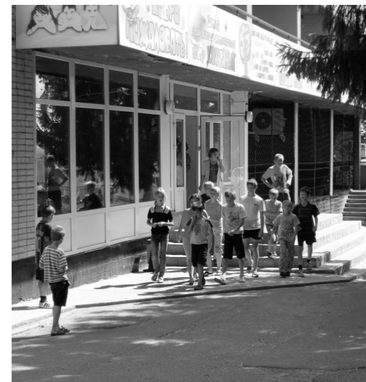
1500 детей отдохнут за лето в лагере «Юбилейный»

10 июля депутаты областного Совета вспомнили пионерское детство. Члены комитета по образованию, культуре, спорту, молодежной политике и туризму побывали в оздоровительно-образовательном центре «Юбилейный» Мценского района.