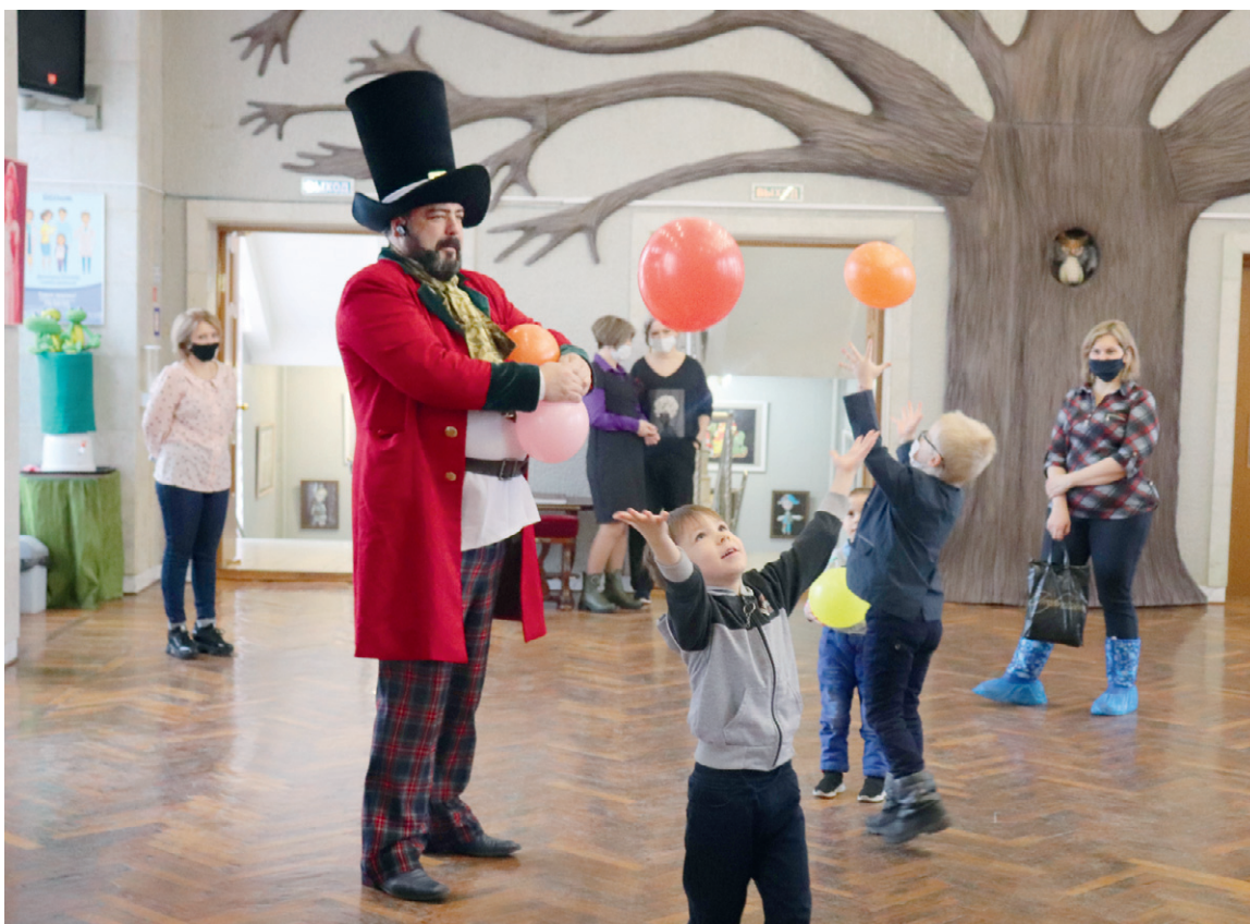
Дарит детям радость кукольный театр