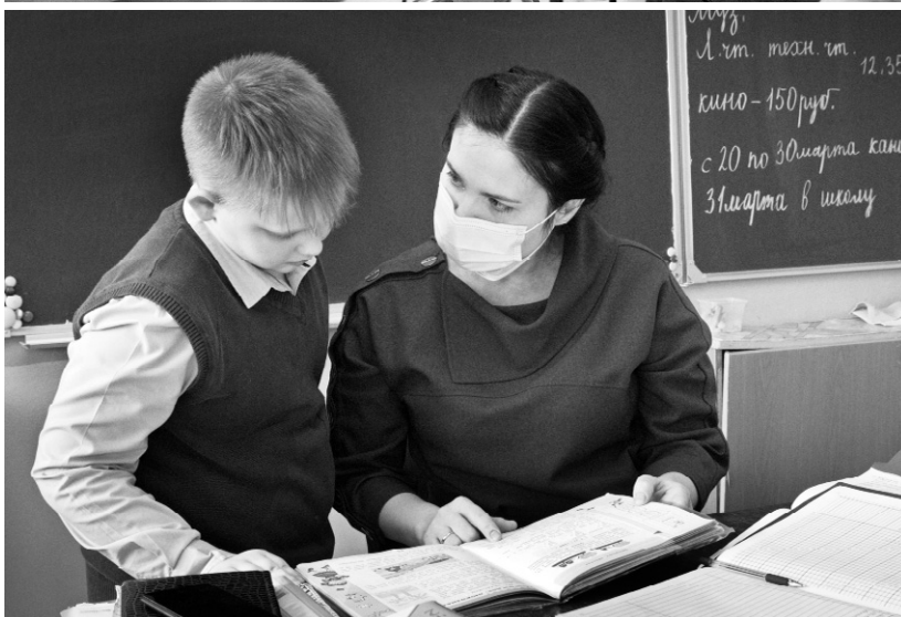
Математика — царица всех наук!

ные блоки, отремонтирован фасад. Общая сумма вложенных составила около 7 млн. рублей.