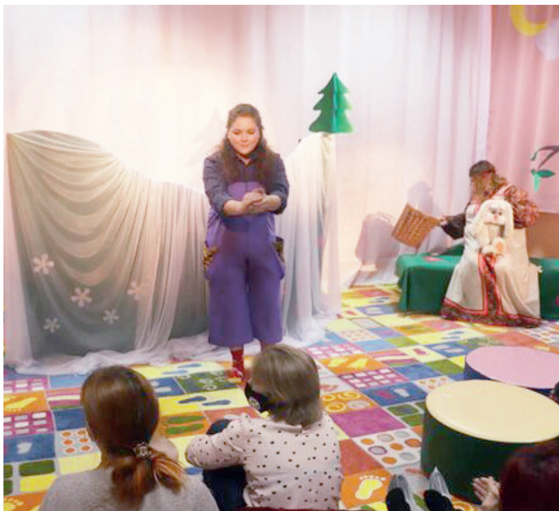
Сказка — совсем рядом

Маленькие гости театра также познакомились с процессом создания кукол в бутафорских мастерских, посмотрели работу артистов и приняли участие в интерактивной постановке «Лиса, Заяц и Петух» (0+). В таком спектакле можно быть не просто зрителем, но и вме-