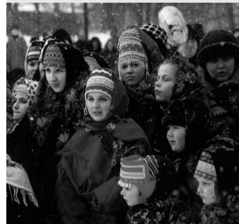
Для справки. Орловский центр культуры осуществляет методическую, практическую, информационную поддержку учреждений культуры муниципальных образований, занимается организацией областных конкурсов, смотрав и фестивалей по различным видам и жанрам самодельного народного творчества с целью выявления новых талантов в орловской глубинке. В сферу деятельности входят работа по изучению и пропаганде традиционных народных промыслов, собрание и изучение народного костюма нашей области, а также песенно-музыкального и хореографического фольклора.